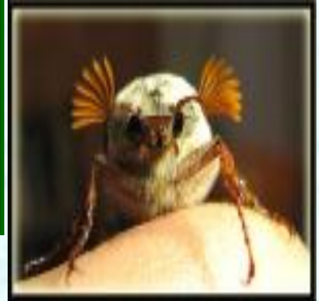
3 майский жук