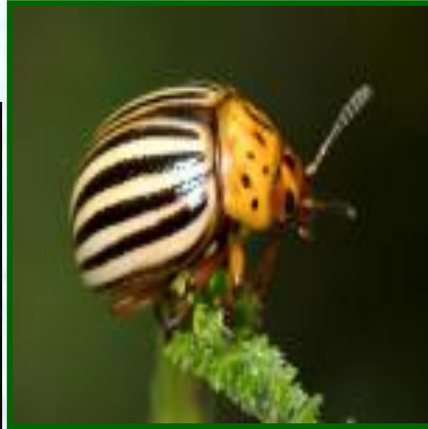
2 колорадский жук