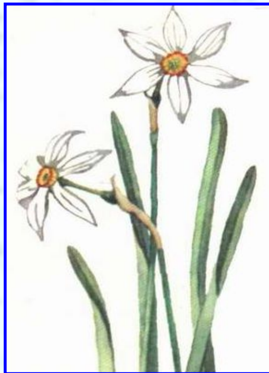
2 нарцисс узколистный