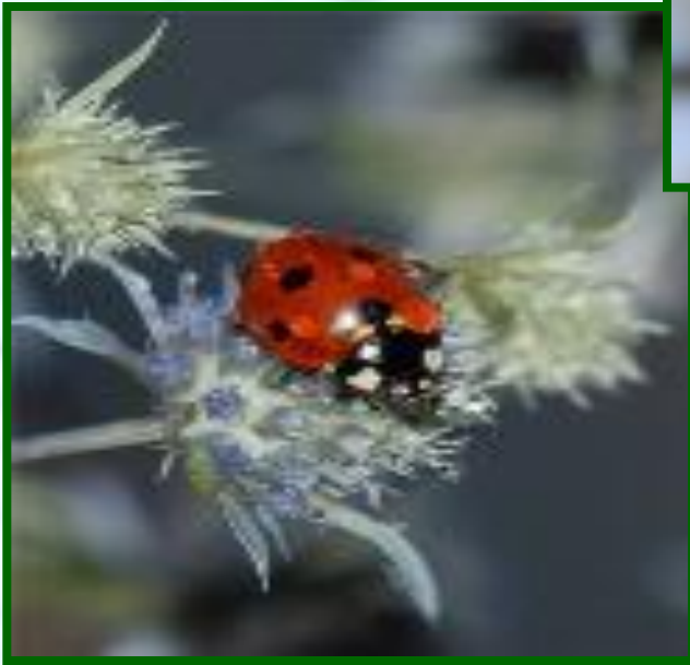
1 божья коровка