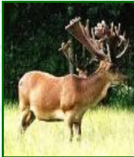
2 кавказский олень