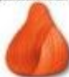
Красный каштан /85