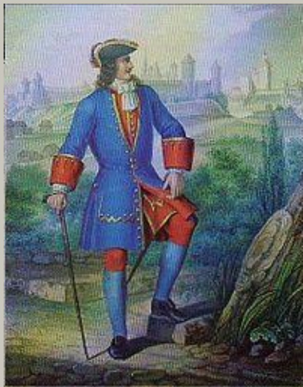
Офицер лейб-гвардии Семёновского полка с 1700 по 1720 год.

Семеновский полк – воинская часть Русской Императорской армии. Был сформирован в 1691 году в подмосковном селе Семеновском, под названием потешных семёновцев; с 1687 года они начали именоваться Семеновским полком, а с 1700 г. – лейб – гвардии Семеновским.