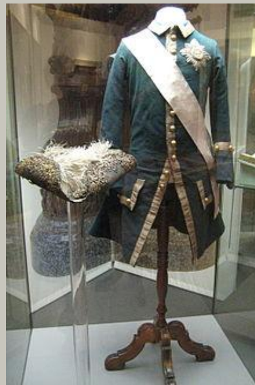
Мундир обер-офицера лейб-гвардии Семёновского полка. Россия, 1756-62.