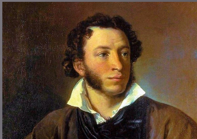
Александр Сергеевич Пушкин (1799-1837) — Солнце русской поэзии