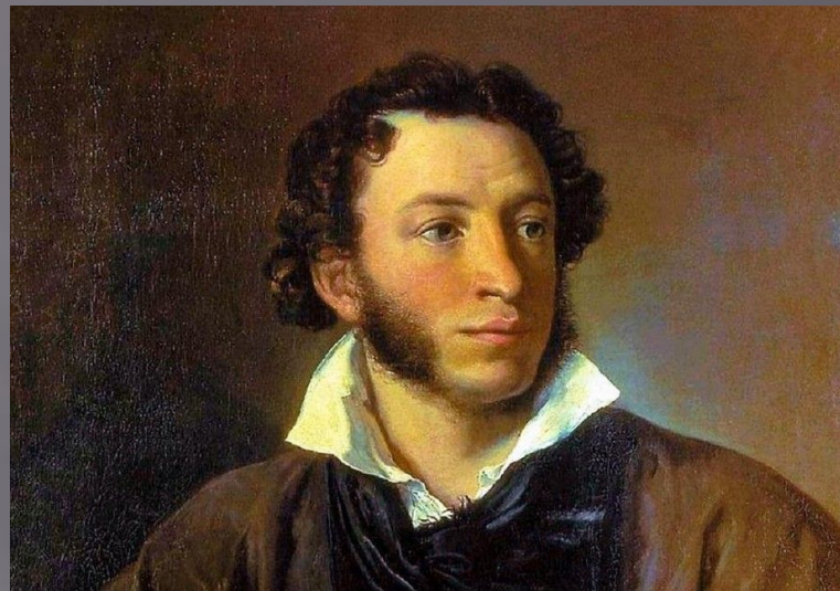
Александр Сергеевич Пушкин (1799-1837) — Солнце русской поэзии