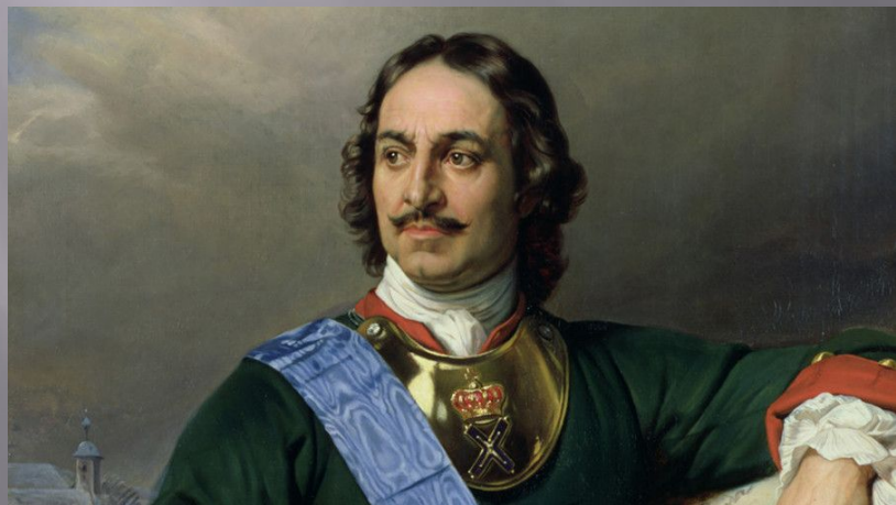
Петр I (1672-1725) — «Чего я хочу, то должно быть»