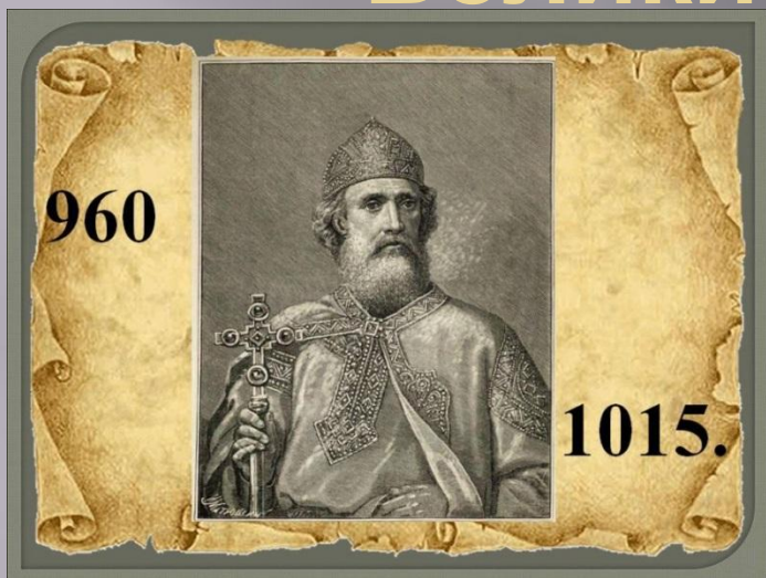
Князь Владимир Святославович (Ок. 952-1015) — Креститель Древней Руси