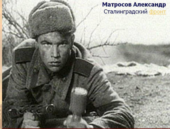
Матросов Александр Сталинградский фронт