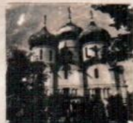
УСПЕНСКИЙ СЕБЕР 1799-1789