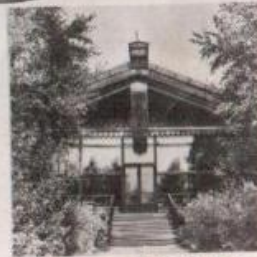
Ресторан «Русская быль»