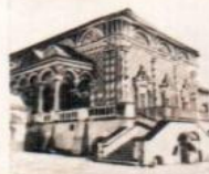
ТРИНИЦА начта с 1627

ПЕРЕЗЪ КЛАМОНЬ ПЕРВАЯ КЛАМОНЬ СЕБЕР ТРИНИЦА — 1422 г. С ВОСНЪ 1540 г. НАЧАЛОСЬ ВОЗВЕДЕНИЕ КЛАМОНЬ СТРАНА: МОНАСТЫРЯ.