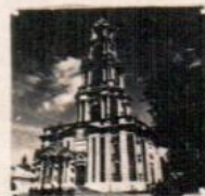
КАЛУЖСКАЯ ЗЛАТОПОЛЬ с 1741