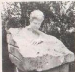
Бюст С.А. Есенина