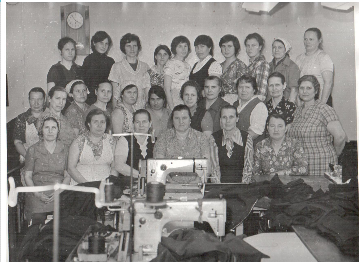
В пошивочном цехе