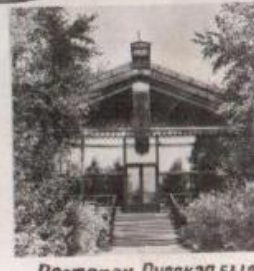
Ресторан «Русская быль»