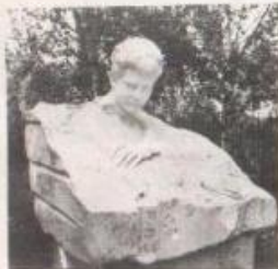
Бюст С.А. Есенина