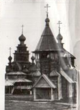
МУЗЕЙ ПЕРВОНАЧАЛЬНОГО ВОС