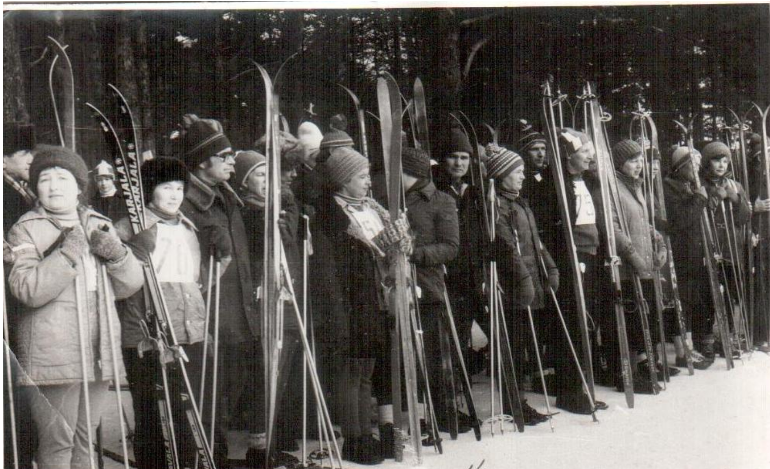
Лыжные гонки в тумском лесопарке