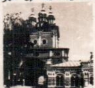
ТРИНИЦА ПЛАТОН ЦЕРКОВЬ 1697-1699