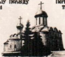
ТРИНИЦЫЙ — СЕБЕР