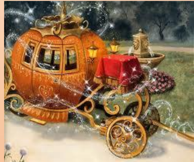
Карета для Золушки