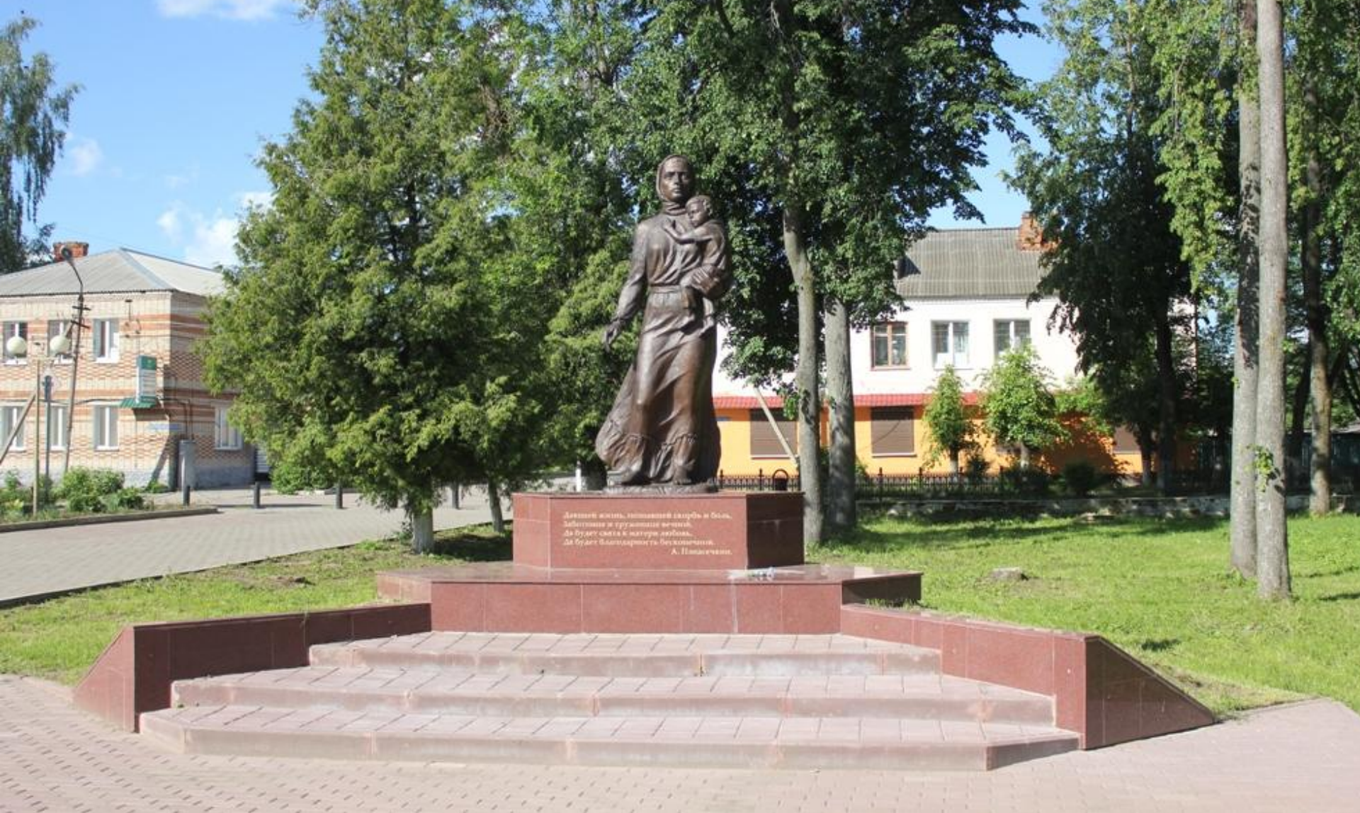
Памятник матери в сквере боевой Славы