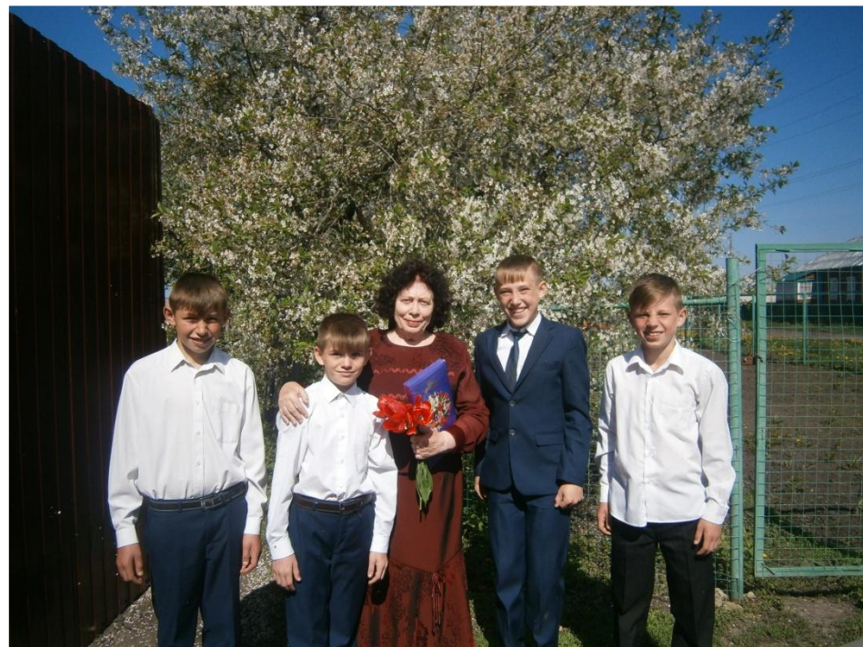
Николаевна Ветеран труда более 30 лет проработала поваром в детском доме