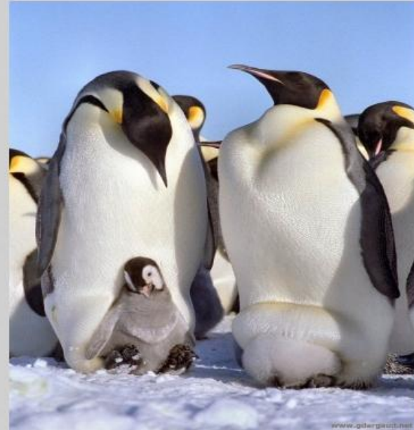
Императорски й пингвин