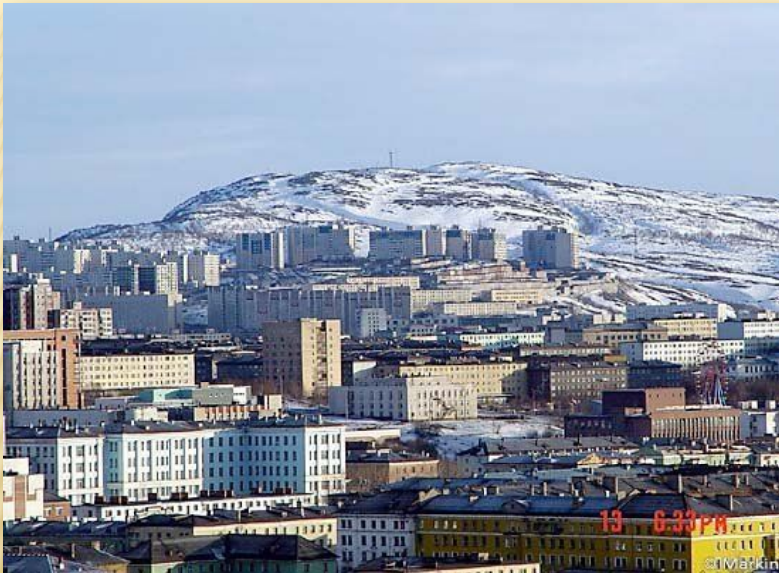
Мурманск – северный город..