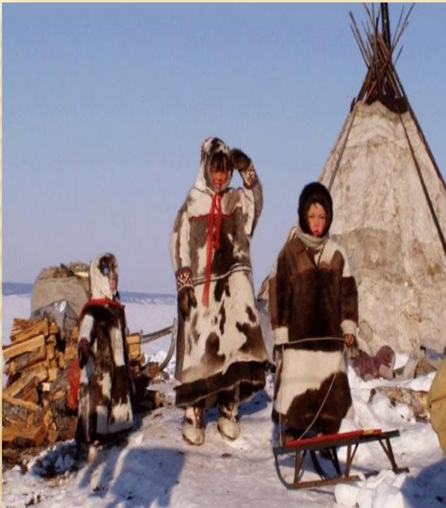
Жители севера эвены