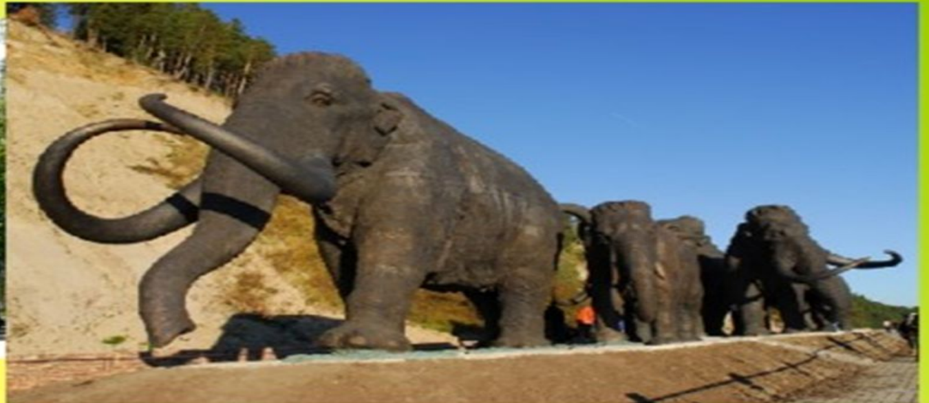
Культурно-туристический комплекс "Археопарк"