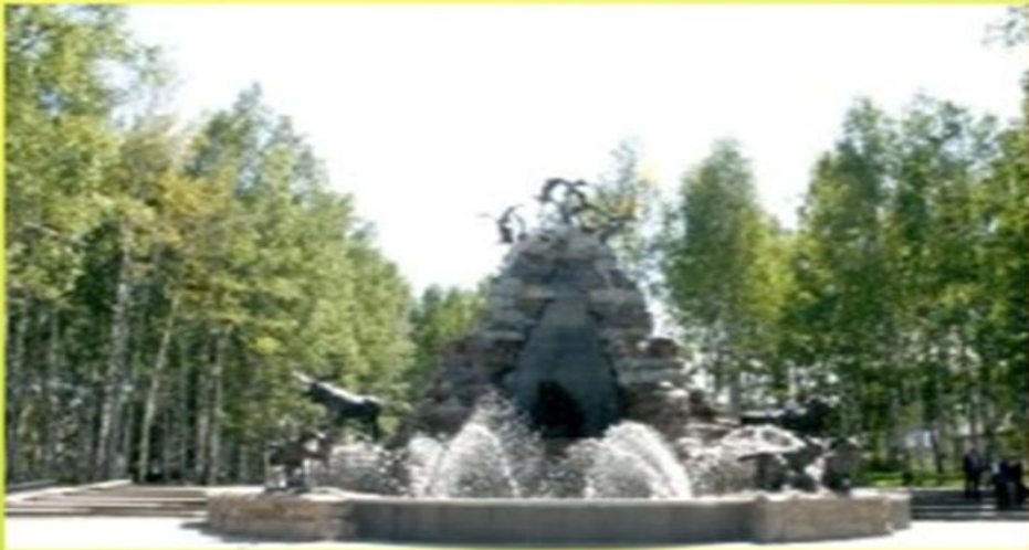
Фонтан "Обь и Иртыш"

Мы ждём всех в гости, у нас есть что посмотреть, у нас есть чем гордиться.