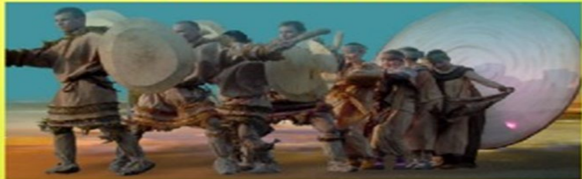
Театр обско-угорских народов