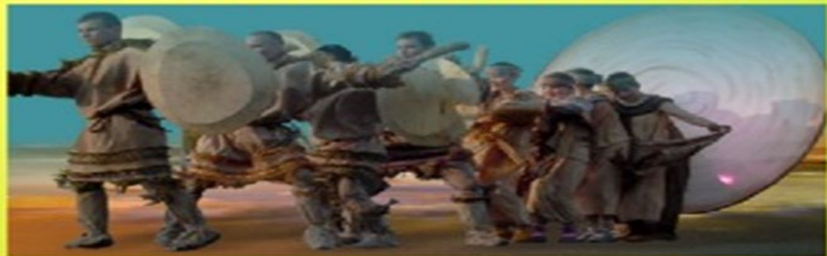
Театр обско-угорских народов