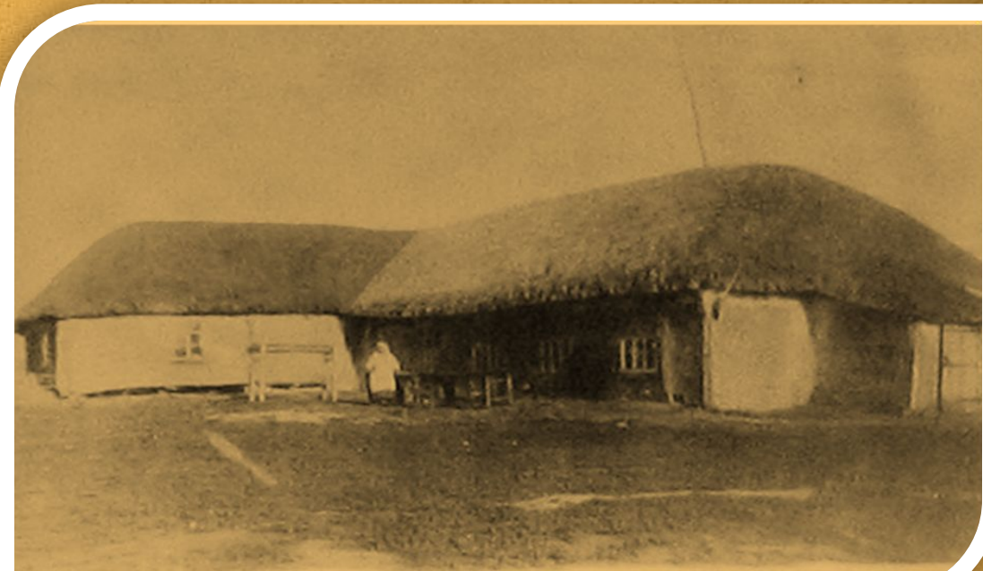
Административное и учебное здание в учебном хозяйстве

История Балашовского техникума механизации сельского хозяйства начинается 10 сентября 1934 года. Он создан в результате объединения Дергачевского и Турковского техникумов на базе существовавшей тогда в Балашове школы «Тракторуч». Именно на основе данной школы, возникло отделение «Механизации сельского хозяйства».