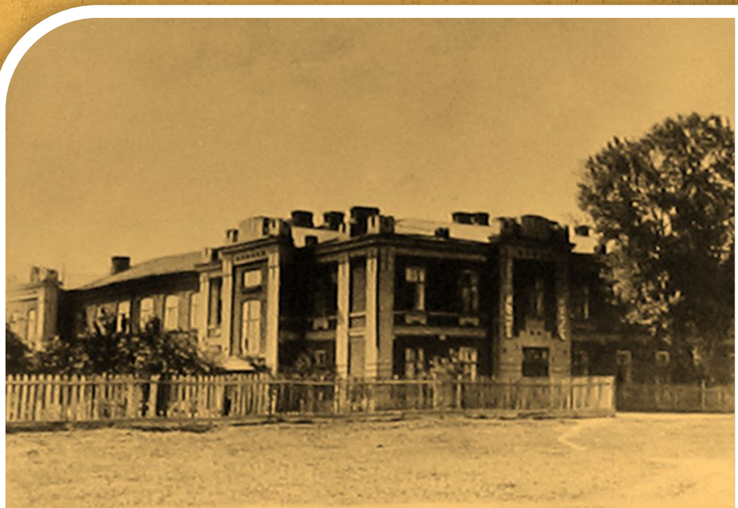
Основное здание техникума, построенное в 1911 году