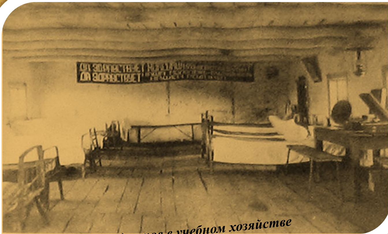
Общежитие студентов в учебном хозяйстве

Первое зачисление студентов в техникум состоялось 3 ноября 1934г. Было принято 38 человек.