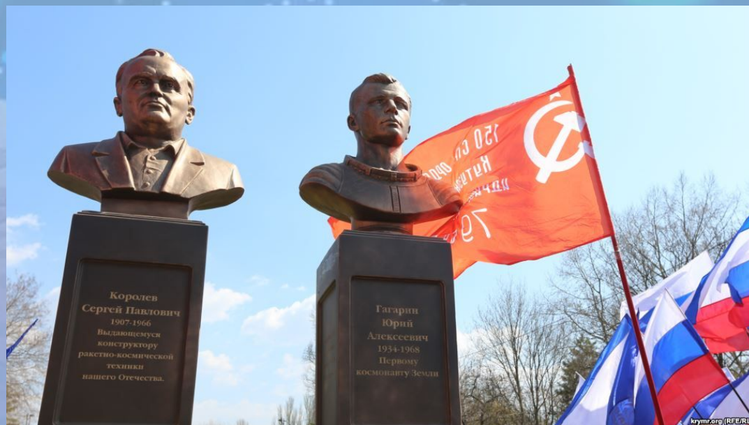
Памятник Ю.Гагарину и С.П. Королеву в Симферополе

В подмосковном Королеве открыли памятник в честь 110-летия со дня рождения советского конструктора Сергея Королева. Скульптурная композиция на площади у ЦДК им. Калинина повторяет известный фотоснимок 1961 года, где ученый сидит на лавочке вместе с первым космонавтом Юрием Гагариным после первого полета человека за пределы Земли.