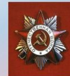
Отечественной Войны II степени