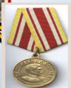
медаль «За победу над Японией»