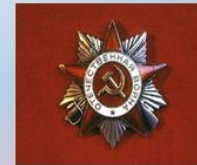
Орден Отечественной войны II степени