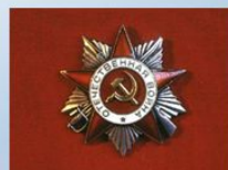
орден Отечественной войны II степени