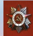
Отечественной Войны II степени