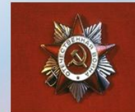
Орден Отечественной войны II степени