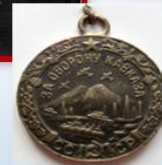
За оборону Кавказа

Рядовой, сапер 128 саперной бригады. Участвовал в боевых действиях с декабря 1943 года по май 1945 года