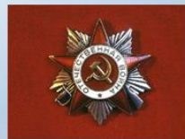
орден Отечественной войны II степени