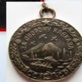
За оборону Кавказа

Рядовой, сапер 128 саперной бригады. Участвовал в боевых действиях с декабря 1943 года по май 1945 года