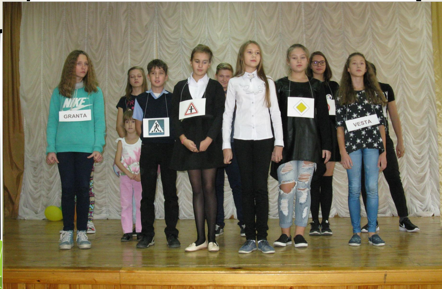
Агитбригада по ПДД