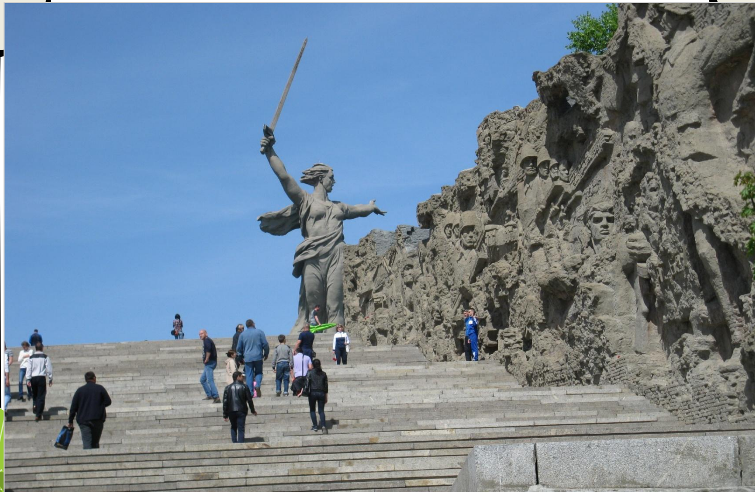
Поездка в город-герой Волгоград