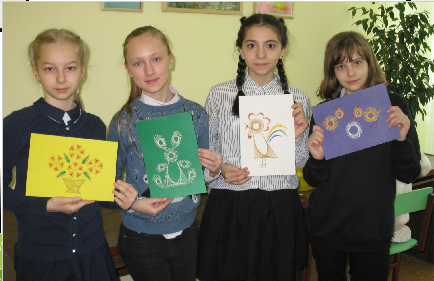
Выставки творческих работ