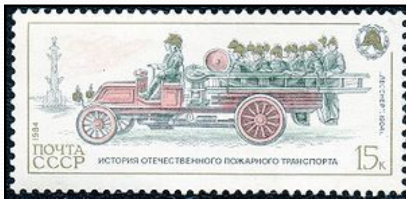
Первые пожарные автомобили (1904 год)