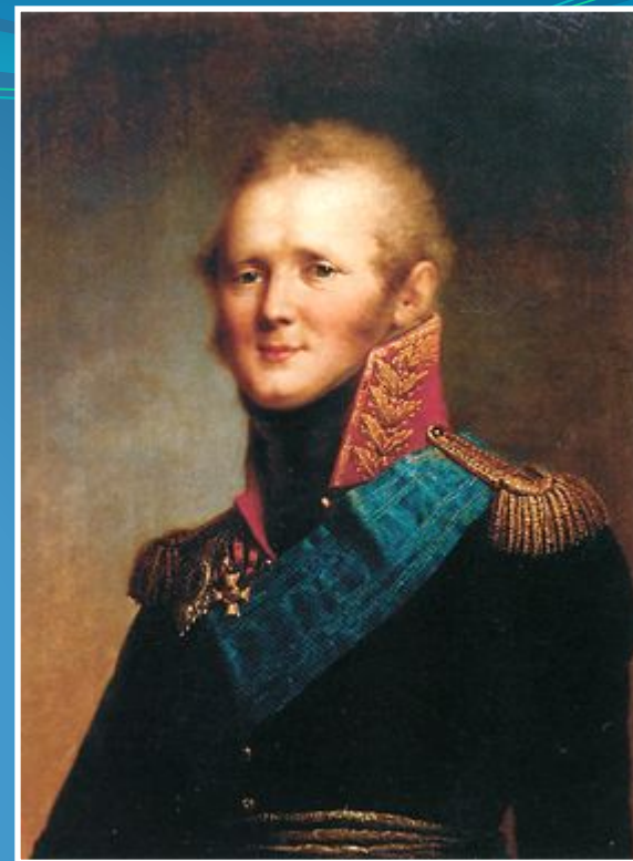
Александр I (1801 – 1825)