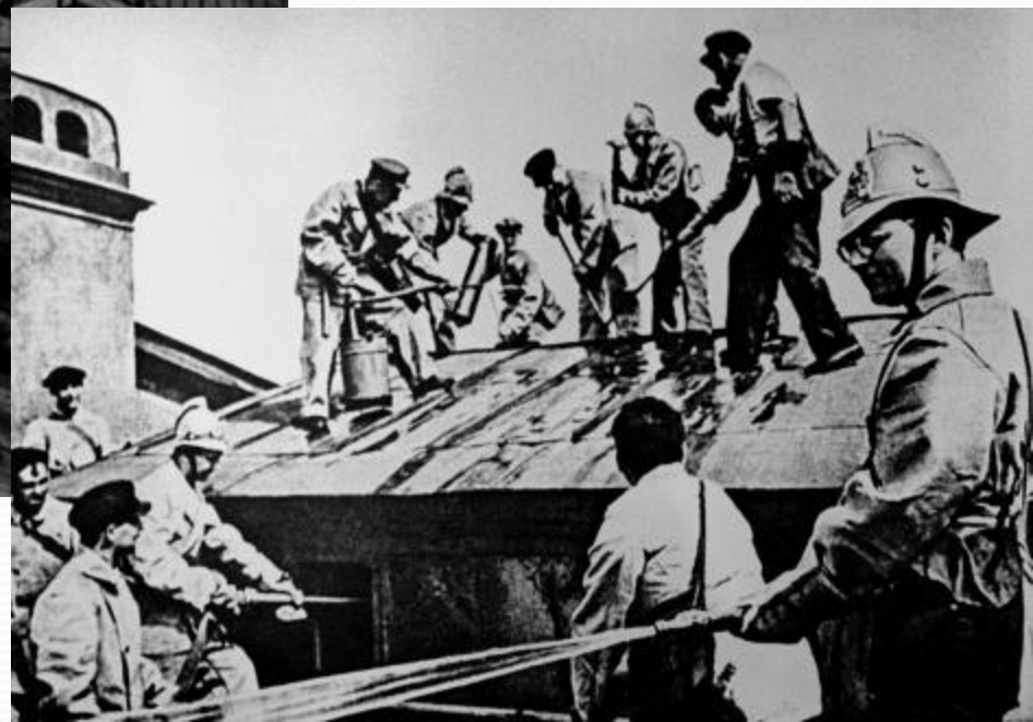
Пожарный расчёт на крыше. 1942 год