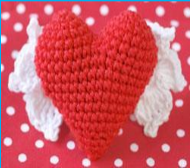
Схема вязания крылышек:

1 ряд: 7вп, 1вп подъема, 6сбн, перевернуть вязание;