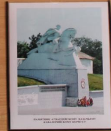
ПАМЯТНИК ГЕРОИЧЕСКОМУ ЗАЩИТНИКУ КАВКАЗСКОГО ФРОНТА