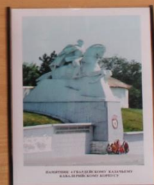
ПАМЯТНИК ГЕРОИЧЕСКИМ ВОИНАМ КАВКАЗСКОГО ФРОНТА