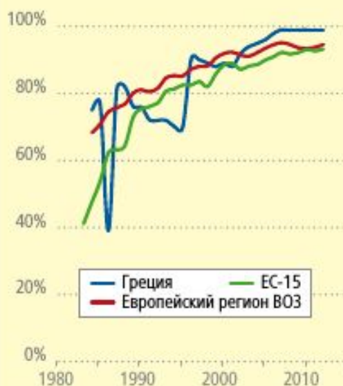
Рис. 11б. Доля детей, иммунизированных против полиомиелита, Греция, Европейский регион ВОЗ и ЕС-15, 1980-2012 гг.