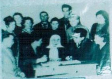
ЖАҚЫНДАРЫМЕН КЕЛІСТІ ЖҮРГЕНС. ПУШКАМИ