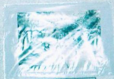
ҚИЛЫМ ЖҮРГІЗІСІНДЕ СЫҒЫН АСТА