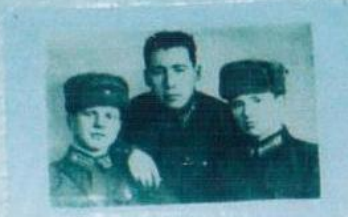
МАЛДАНАС ЖОЛДАСТАРЫ БОИЫЕ ДРУЗЬИ