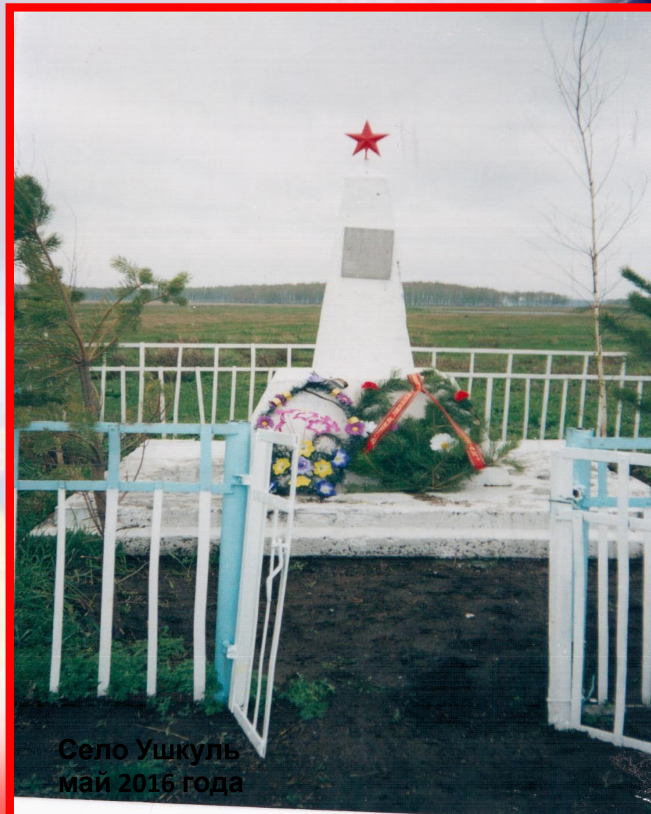
Село Ушкуль май 2016 года

«Давай, девятого, помянем их, Кого сегодня нет уже в живых... Кто так и не вернулся в сорок пятом, Оставшись в нашей памяти солдатом... И тех, вернулся кто, но вскорости ушёл — На свете том пристанище нашел... Виной всему — жестокая война, Дающая посмертно ордена, Изранившая души и тела, Принесшая живому столько зла!!! Защитники! Вас свято будем читать, И годы страшные те в памяти хранить»