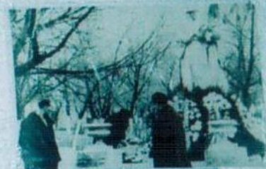
КЕҢІС ҚИЛЫМДЫ АСТАРЫ ОҚУ ЖҮРГІЗІСІНДЕ АҚПАРТҚАН ГЕРОЮ СОВЕТСКОГО СОЮЗА АҚУ ЖҮРГІЗІСІНДЕ