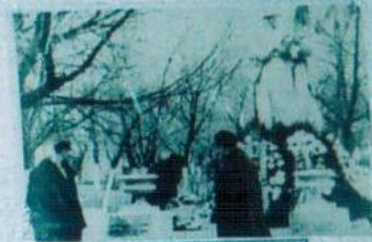
КЕҢІС ҚИЛЫМЫН АСТАРЫ ОҚЫ-ЖІЗНЕСІМЕН ТӨРТУЛЫ АҚП. ТЕНІС ЖҮРГІЗІ ІС. МАЛДАНАС ГЕРОЮ СОВЕТСКОГО СОЮЗА АҚП. ЖОЛДАСТАРЫ