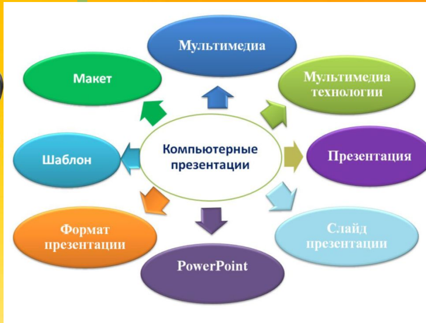
Базовый лист знаний