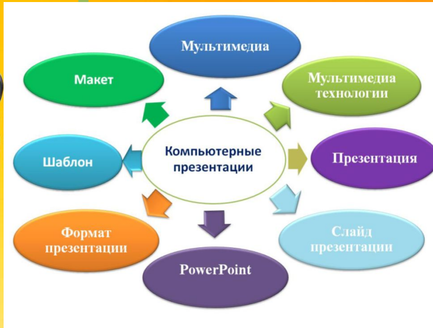
Базовый лист знаний