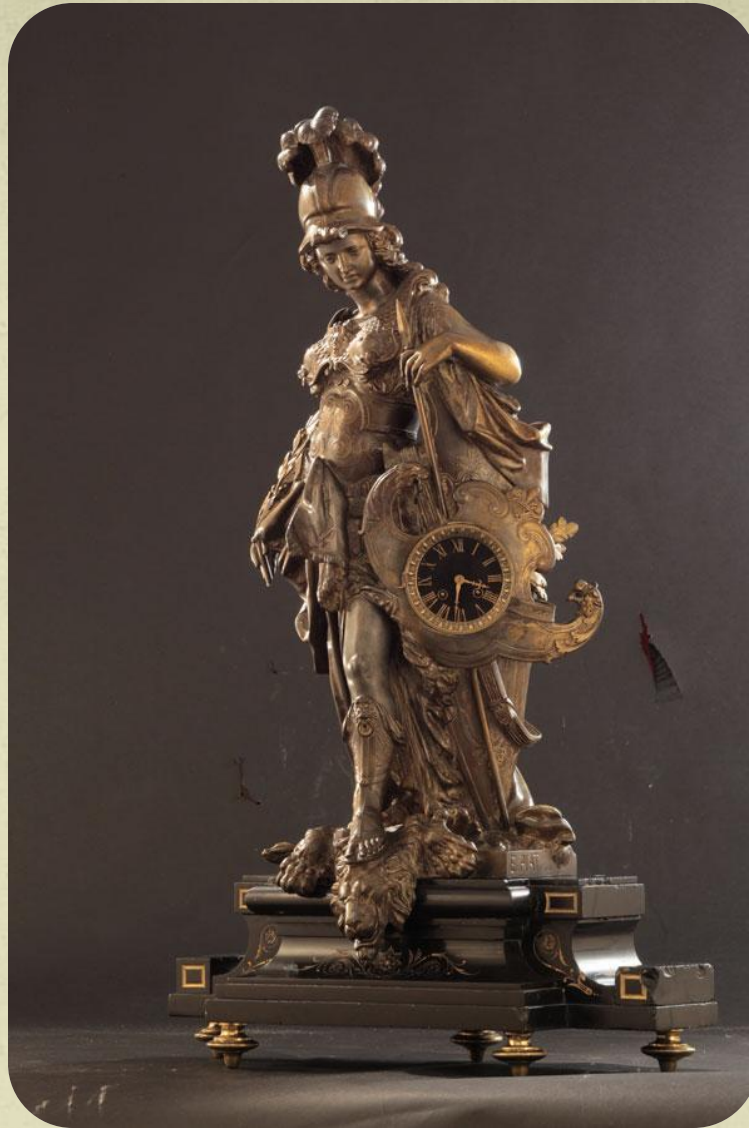
Часы с изображением греческой богини Афины Паллады