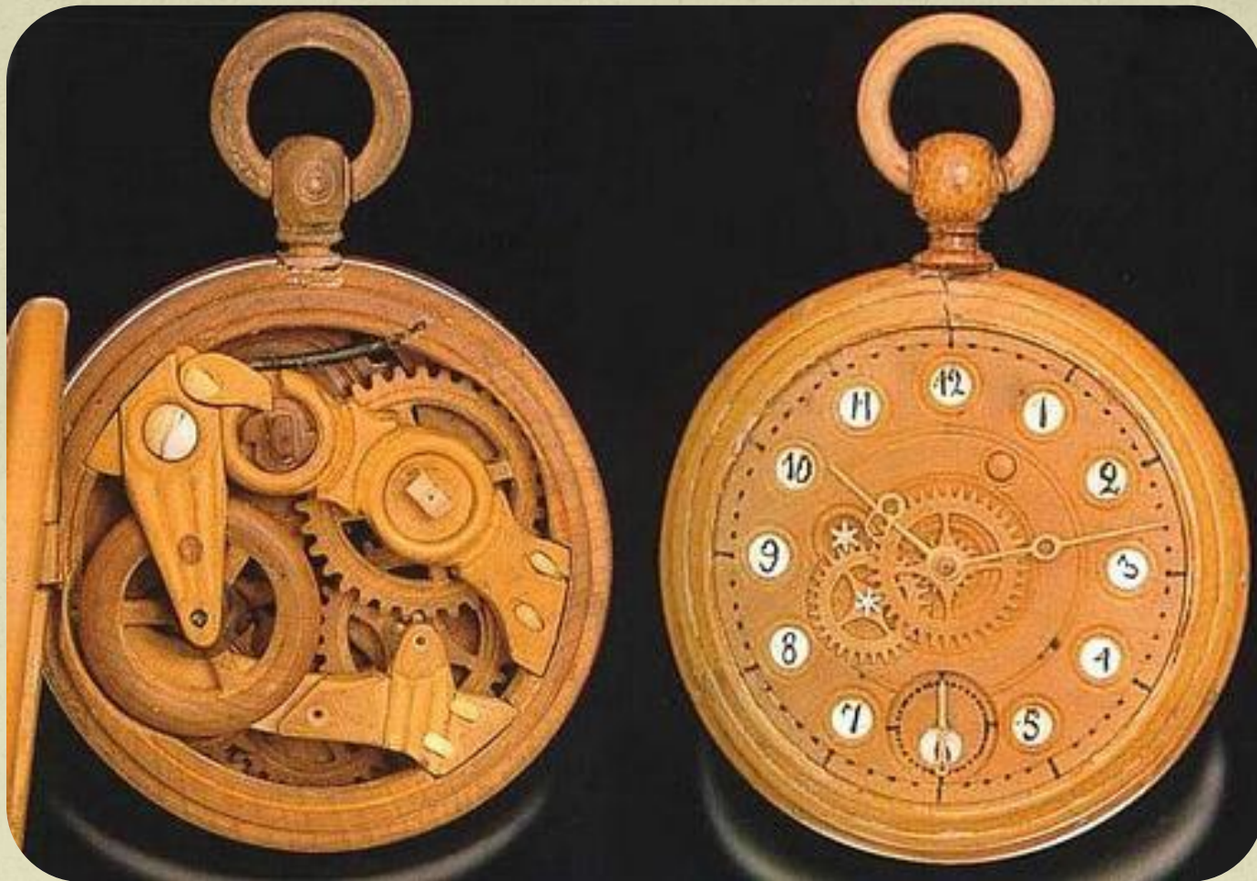
Деревянные часы Бронникова