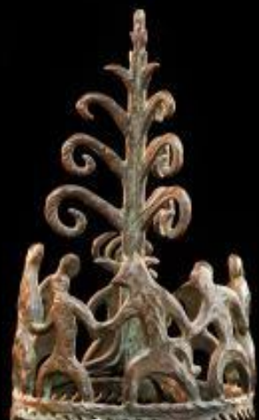
ПРАЗДНИК В ТАЙГЕ