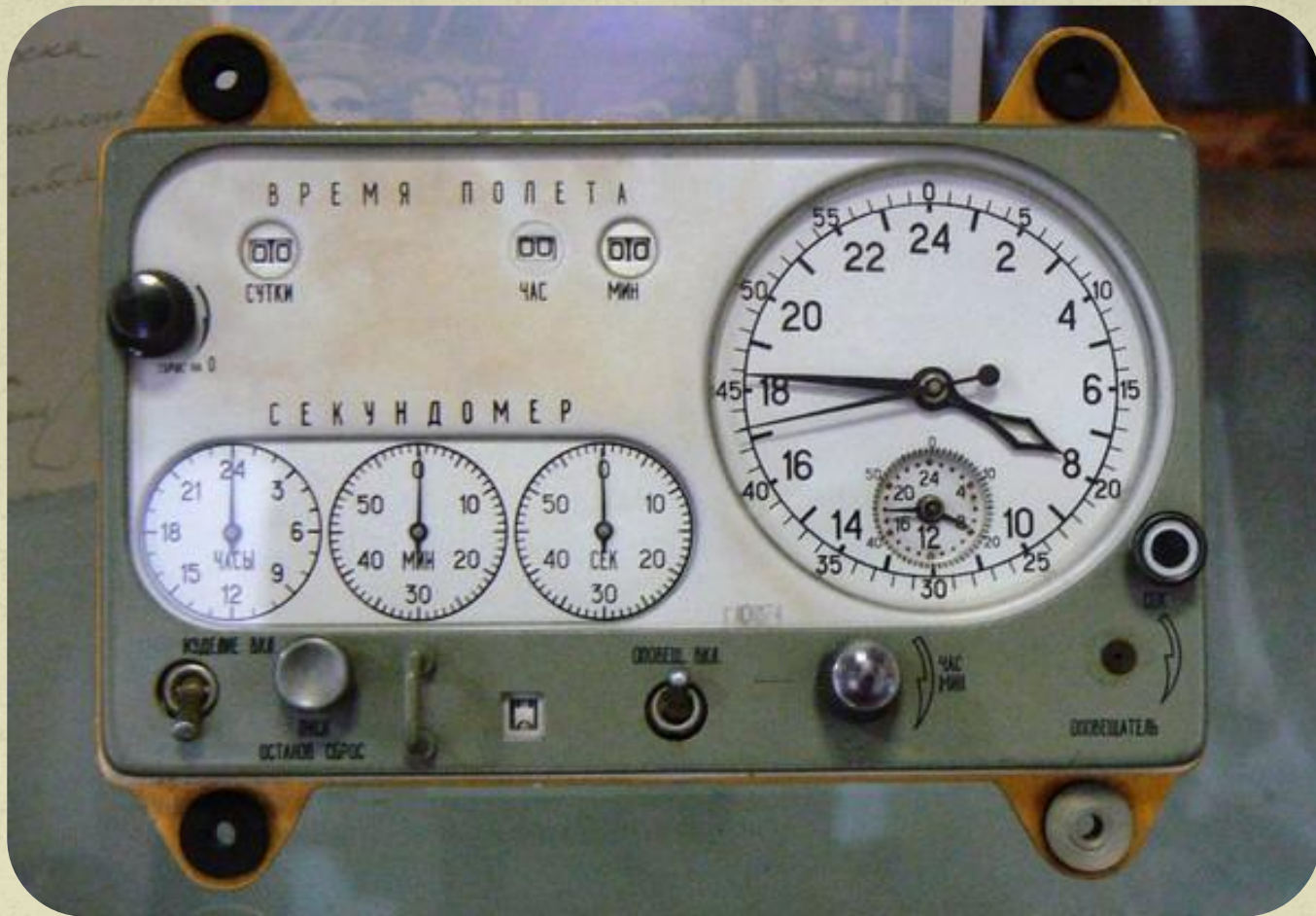
Космические часы со станции «Салют-6»