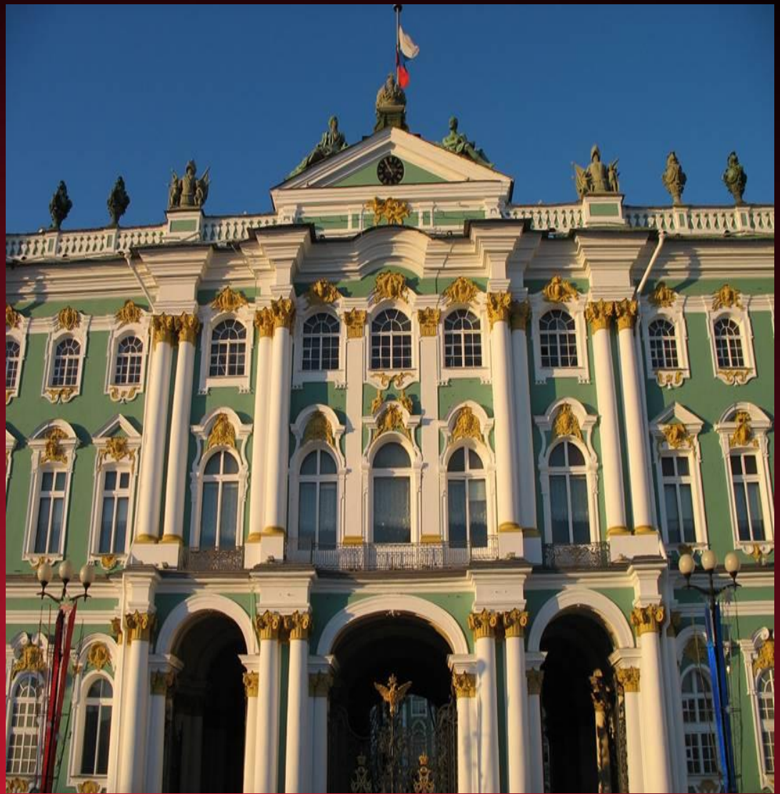
Растрелли. Зимний дворец. 1754 - 1762