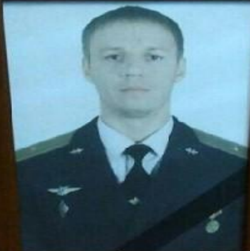
Пилот сбитого Су-25

в Сирии, погибший в бою, майор Роман Филиппов.