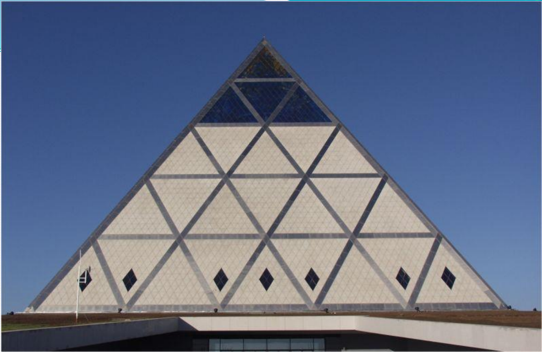
Бейбітшілік және келісім сарайы