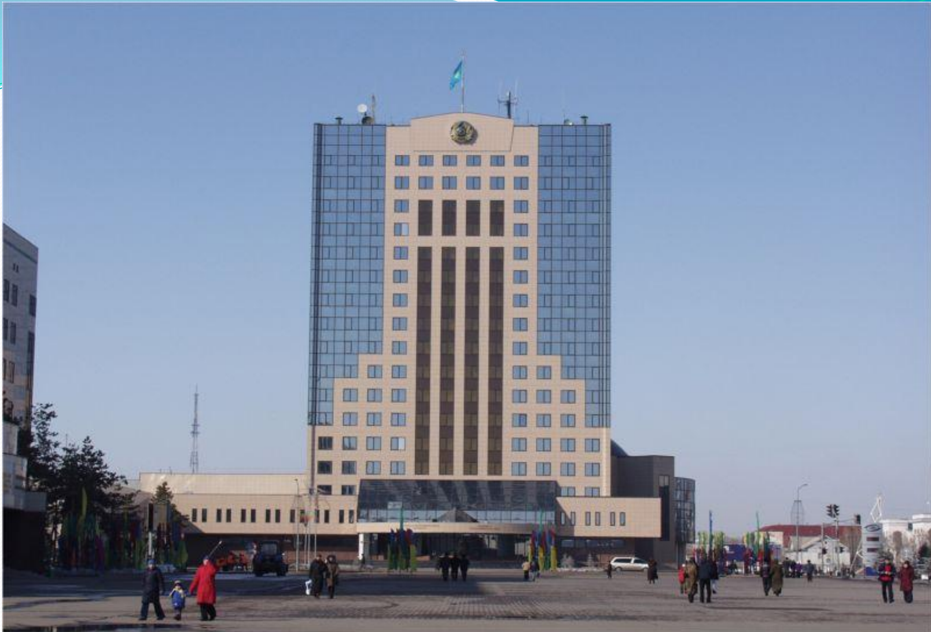
Бұрынғы парламент үйі