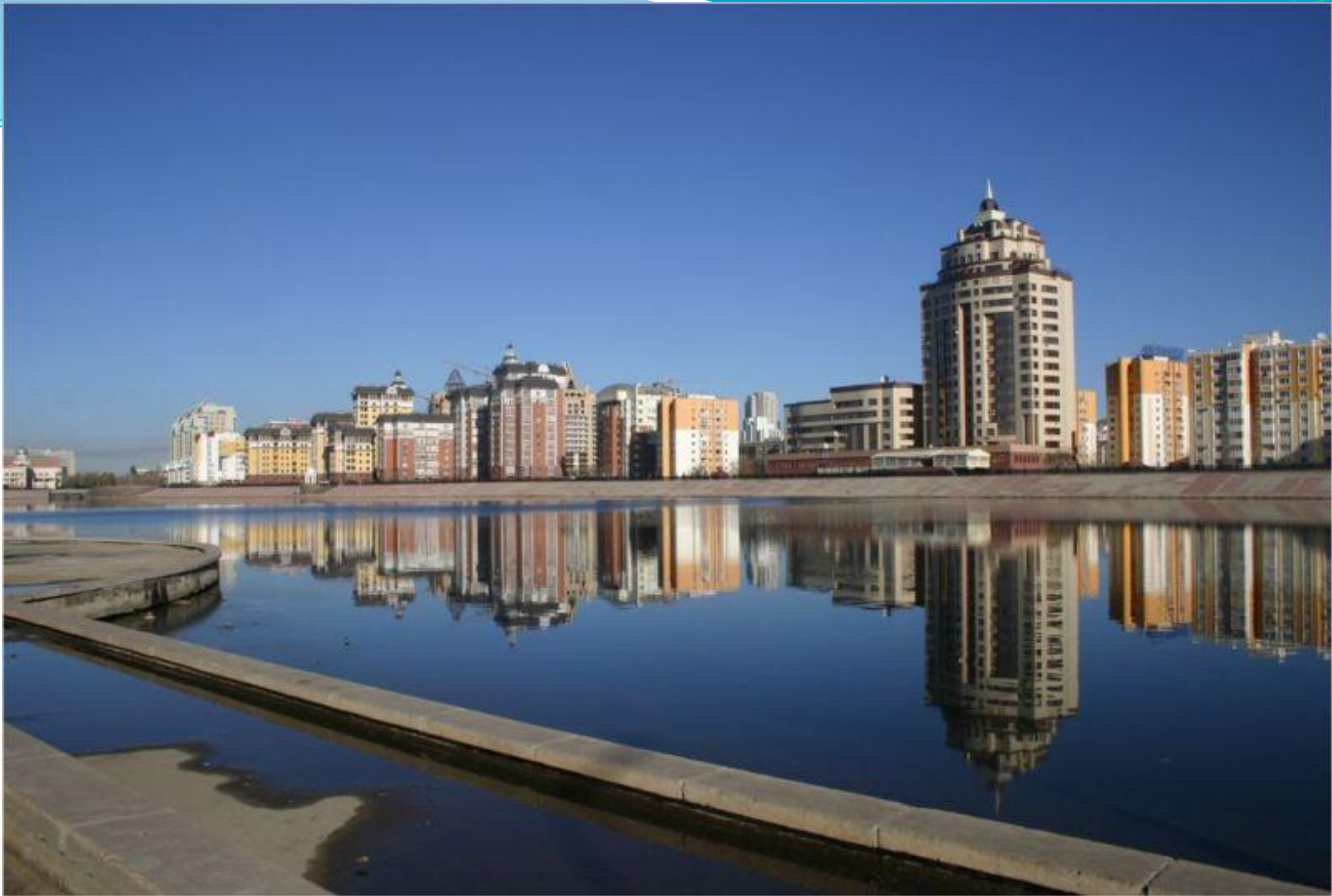
Erke Esil өзені