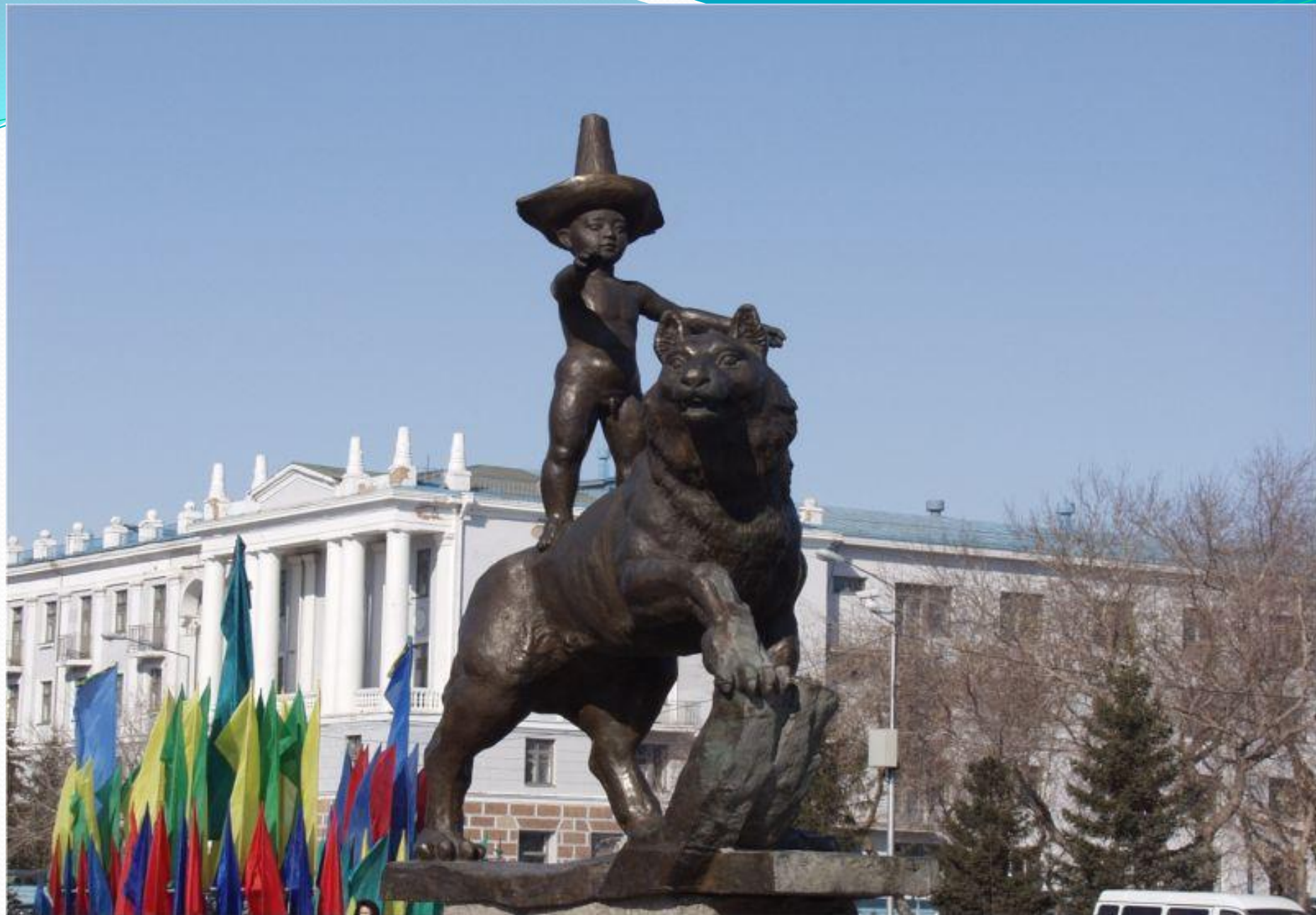
60-шы жылдары салынған “Есіл” қонақ үйі