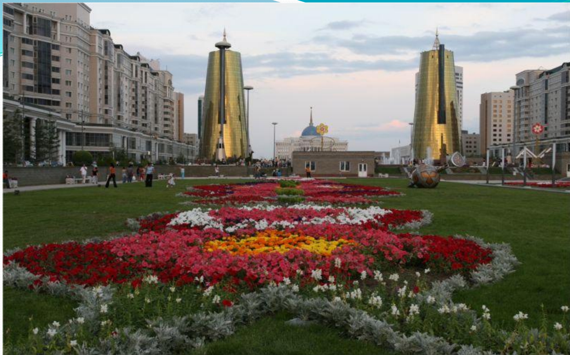
Қарыштай бер, Астана