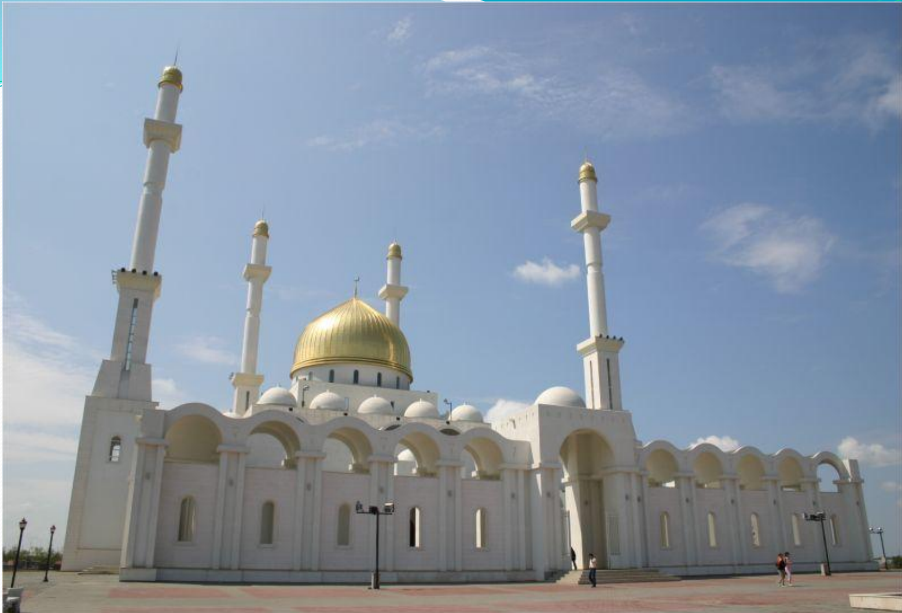
Ислам мәдениет орталығы