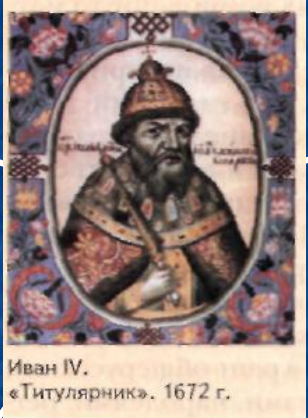
Иван IV. «Титулярник». 1672 г.