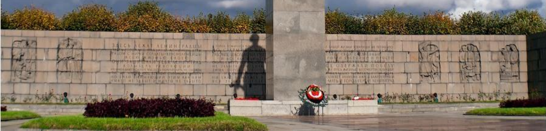
Скульптура “МАТЬ - РОДИНА”