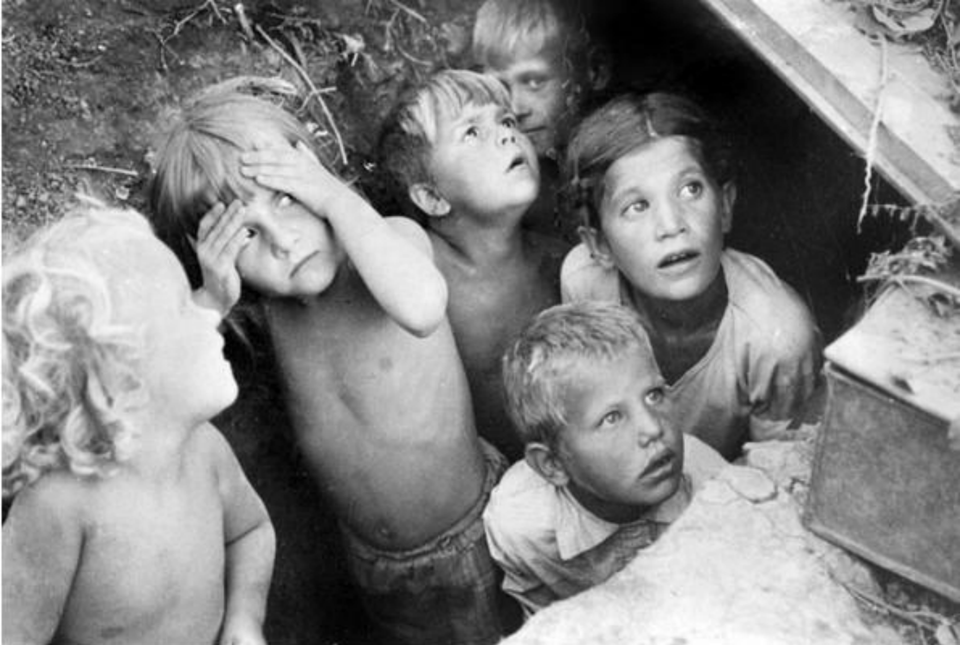
Дети Сталинграда прячутся от налёта. 1942 г.