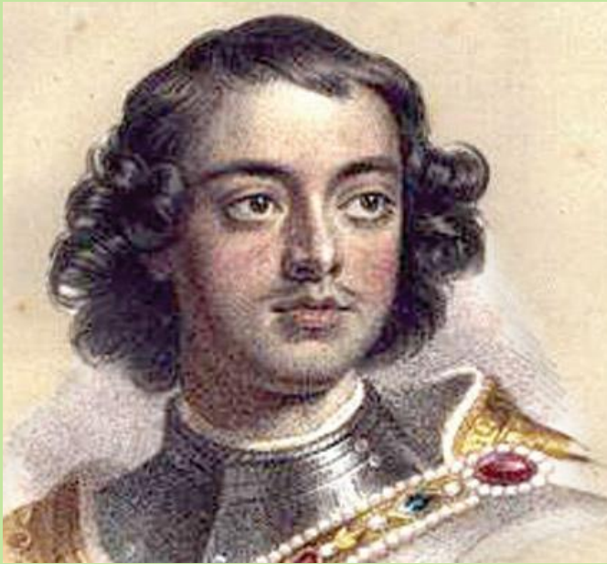
Петр Первый, Российский император