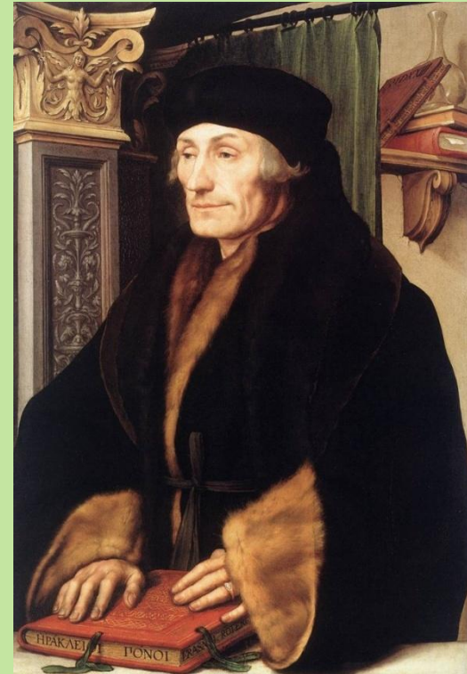
Эразм Роттердамский, выдающийся гуманист нач. 16 века