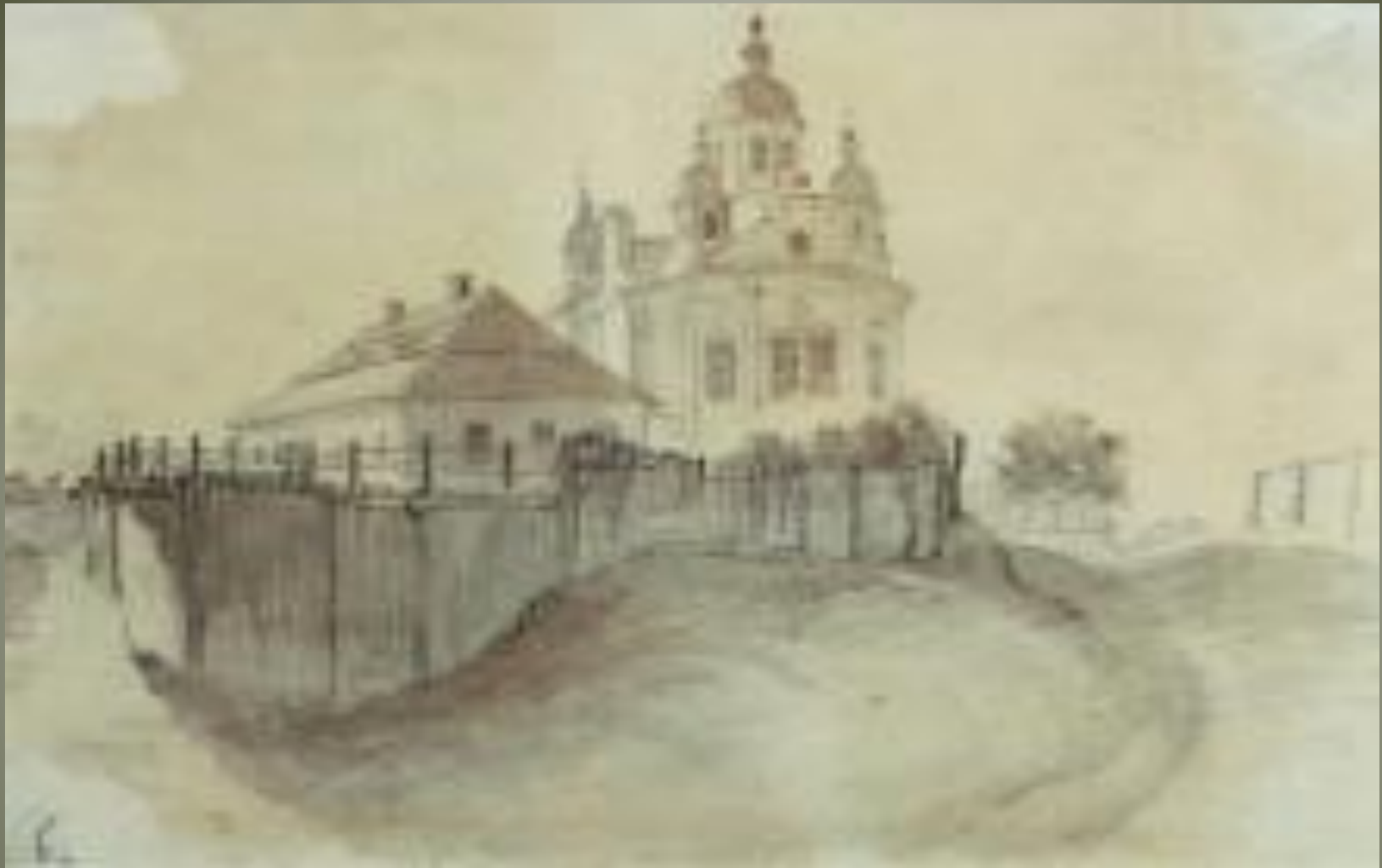
Будинок Котляревського у Полтаві, робота Тараса Шевченка 1845 р.