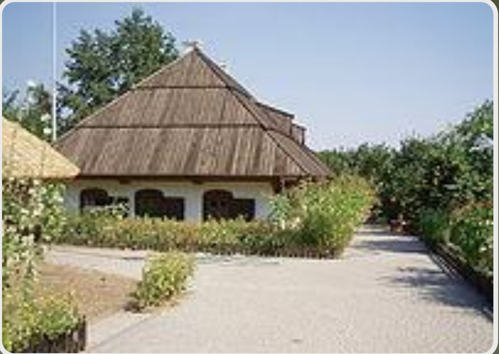
м.Полтава Садиба-музей І. П. Котляревського