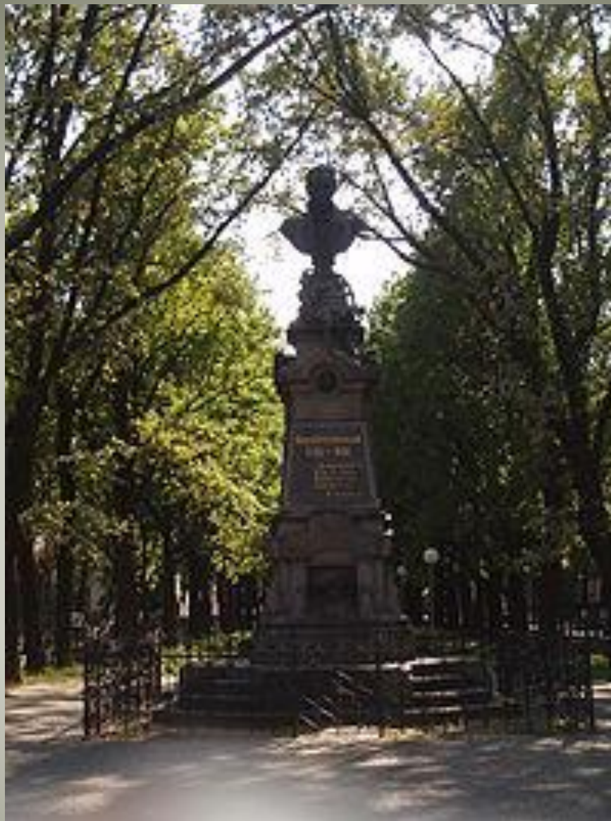
Пам'ятник Івану Котляревському в Полтаві