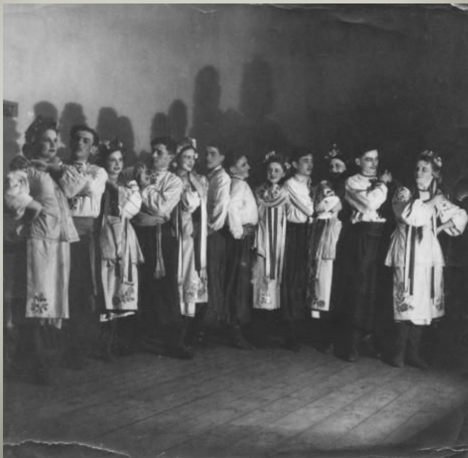
Вистава "Наталка Полтавка". Вінниця, 1941 р.