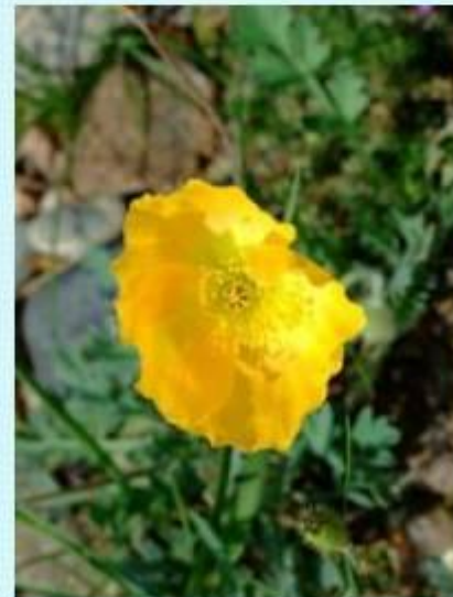
Желтый полевой мак