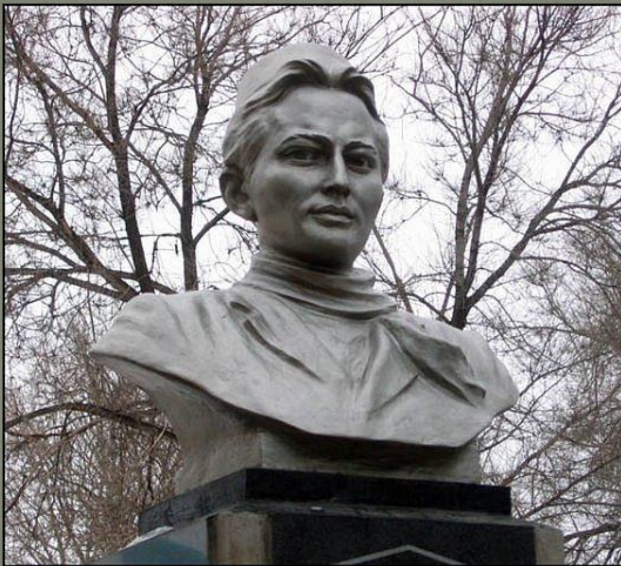
Памятник Г.Тукаю в Казани