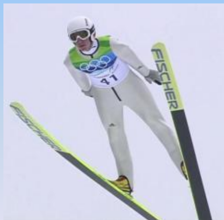
Прыжки с трамплина