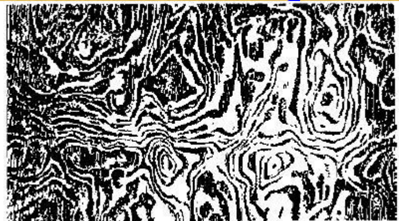
Коленчатый узор булата (увеличение в 3,5 раза)