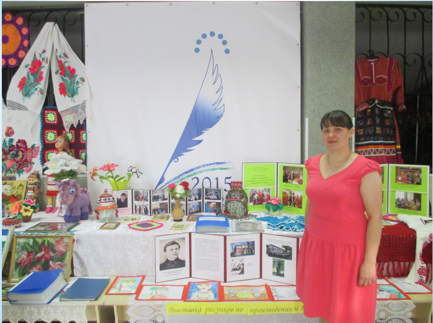
Выставка рисунков по произведениям Т