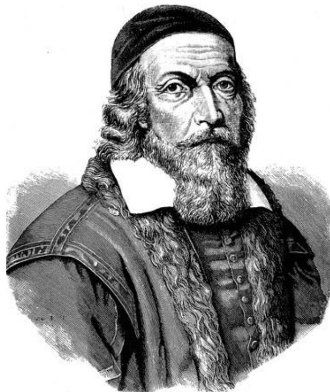
Ян Амос Коменский