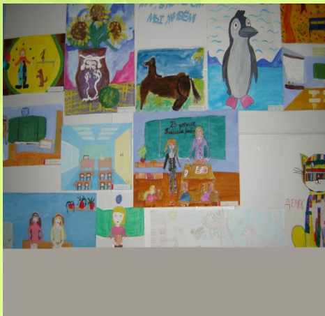
«Путешествие по стране этикета»