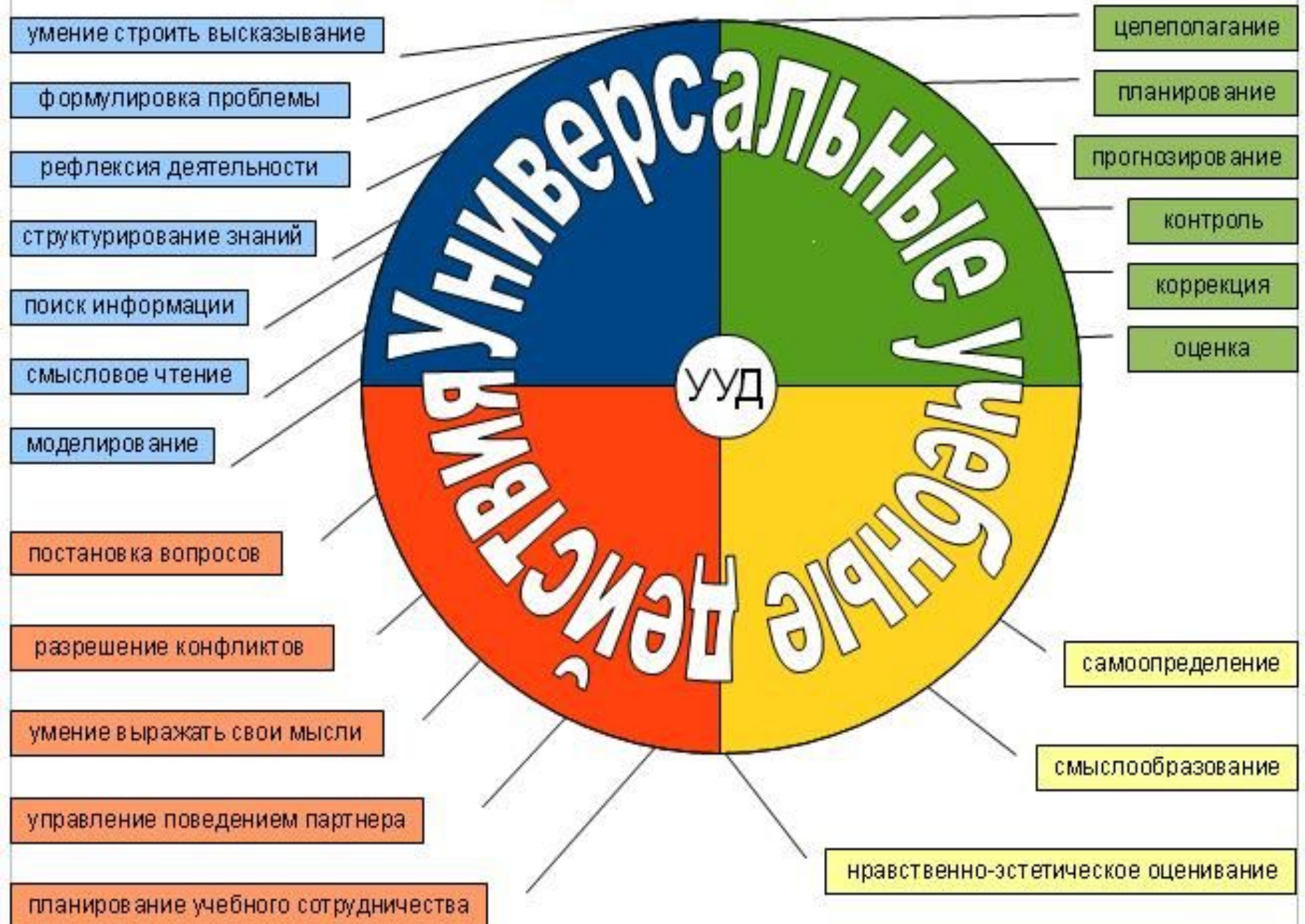
Схема. Номенклатура универсальных учебных действий (УУД) ■ Познавательные ■ Коммуникативные ■ Личностные ■ Регулятивные