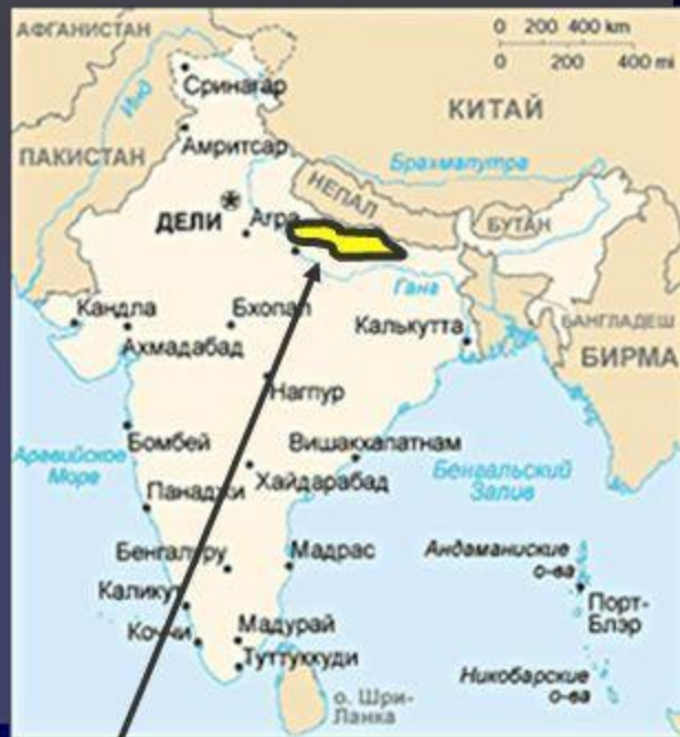
Место рождения Будды

Религиозный мыслитель, чьё учение стало основой одной из трёх мировых религий - буддизма