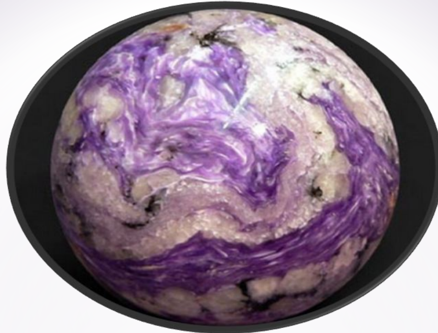
Художественное изделие в форме земного шара