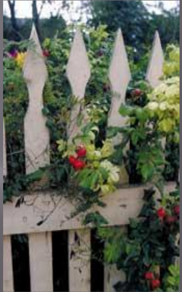
Граница - фрагмент забора