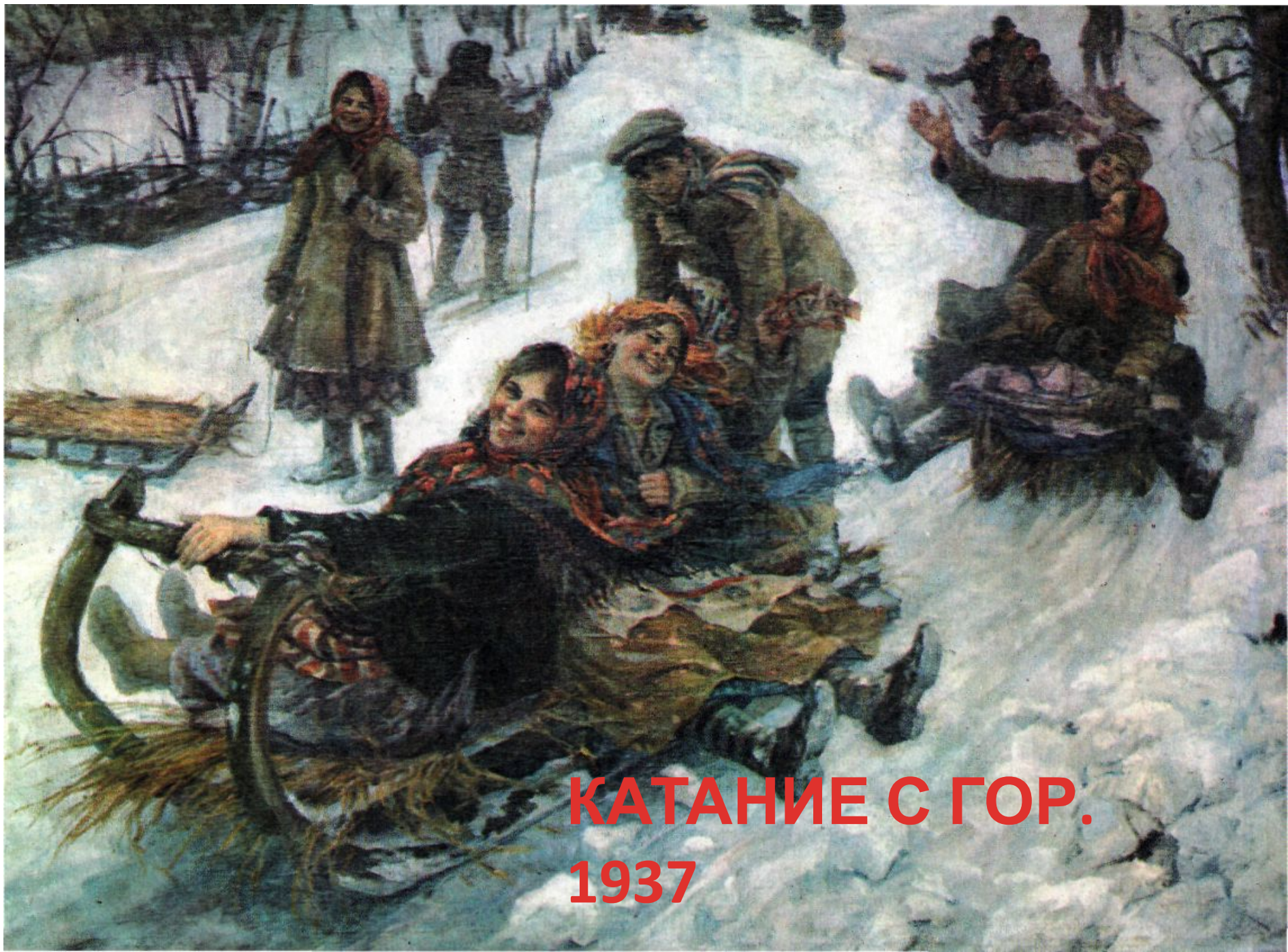
КАТАНИЕ С ГОР. 1937