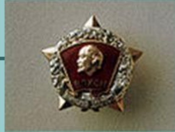
Нагрудный Знак ЦК ВЛКСМ «Воинская доблесть»