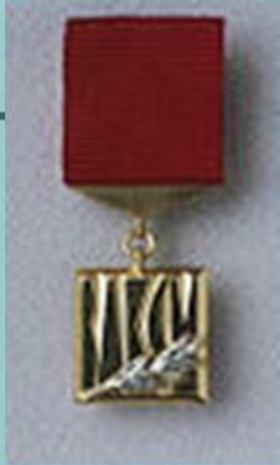
Знак Лауреата Премии Ленинского комсомола. Учрежден в 1966 году