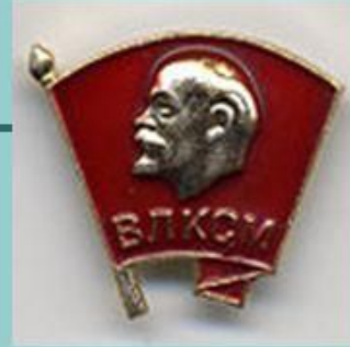
Нагрудный членский значок Комсомольца ВЛКСМ