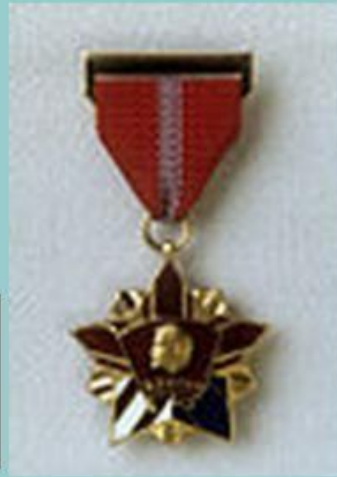
Почетный знак ВЛКСМ. Учрежден 28 марта 1966 году.