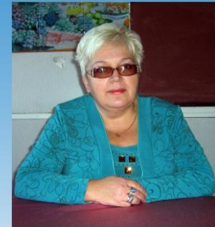
Преподаватель предмета “Технология приготовления пищи”