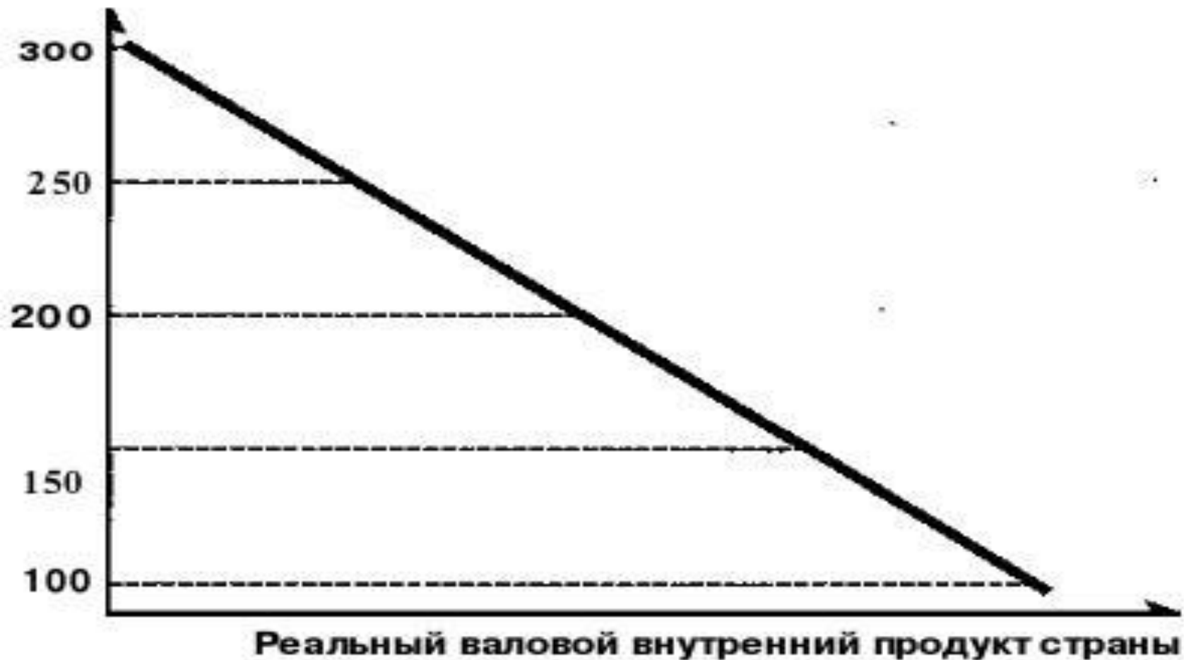
Рис. 2. Кривая совокупного спроса страны