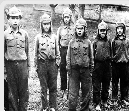
Награжденные медалями «За оборону Ленинграда»

За призывом юных сердец становились подпольщиками, партизанами, чтоб отомстить врагу за смерть родителей и братьев, за надругательство над матерями и сестрами, за сожженные дома, за все нечеловеческие преступления фашистов. Они погибали в боях, их истязали гитлеровцы, но юные герои не казались.