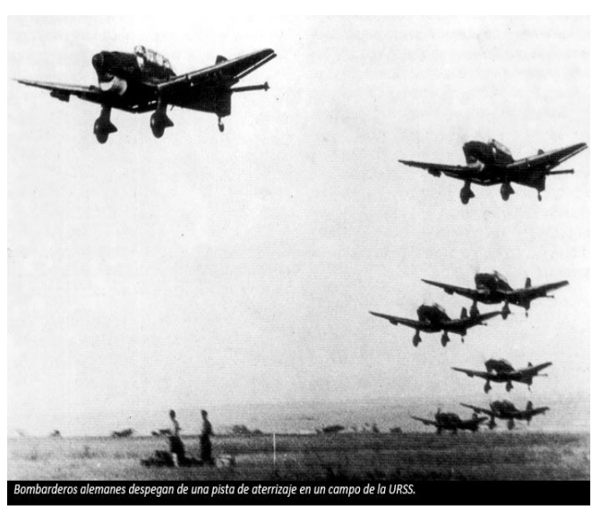
Bombarderos alemanes despegan de una pista de aterrizaje en un campo de la URSS.

Тогда и началась Великая Отечественная война за честь и независимость нашей Родины.