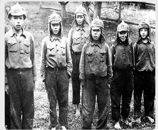
Награжденные медалями «За оборону Ленинграда»

За призывом юных сердец становились подпольщиками, партизанами, чтоб отомстить врагу за смерть родителей и братьев, за надругательство над матерями и сестрами, за сожженные дома, за все нечеловеческие преступления фашистов. Они погибали в боях, их истязали гитлеровцы, но юные герои не казались.