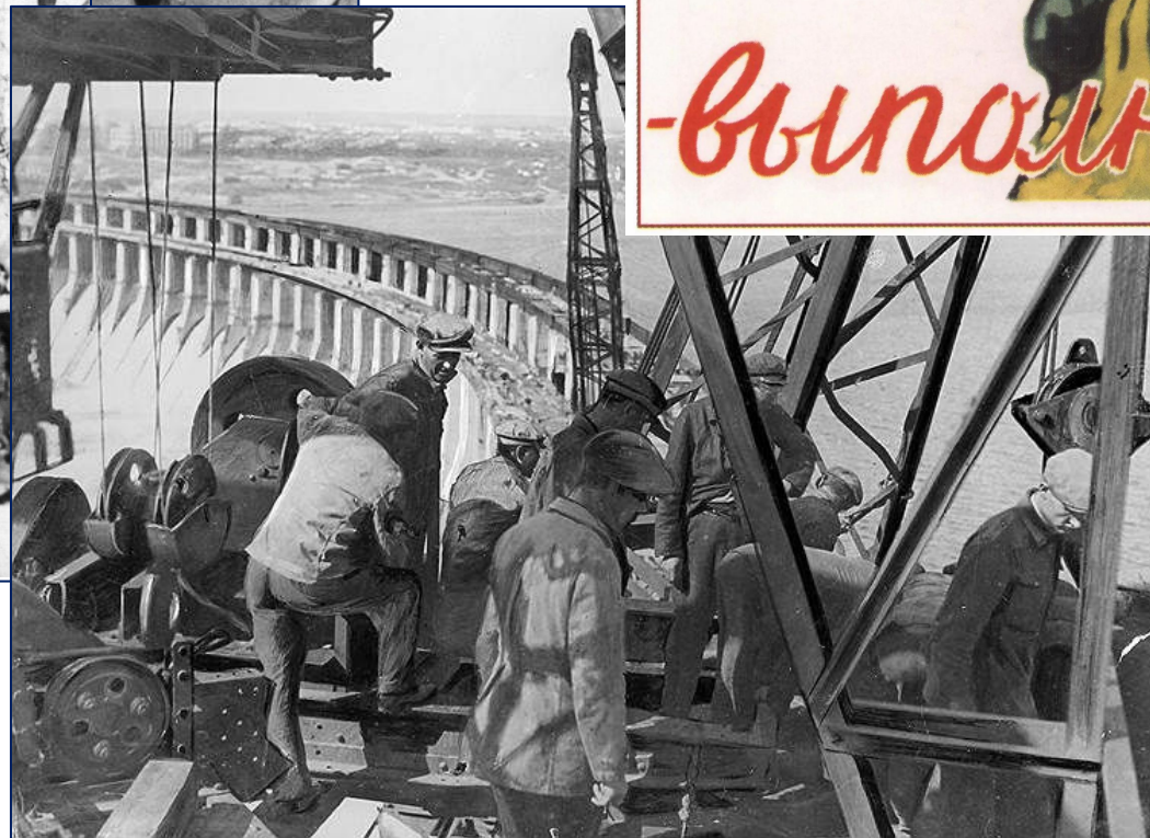
Комсомольцы на Амуре. С картины художника А. Руднева