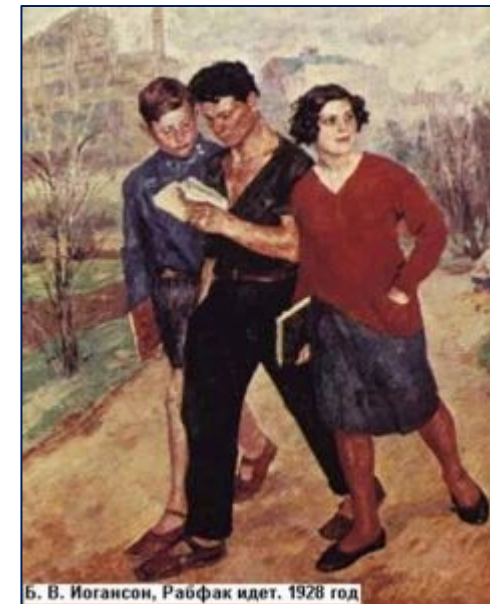
Б. В. Иогансон, Рабфак идет. 1928 год