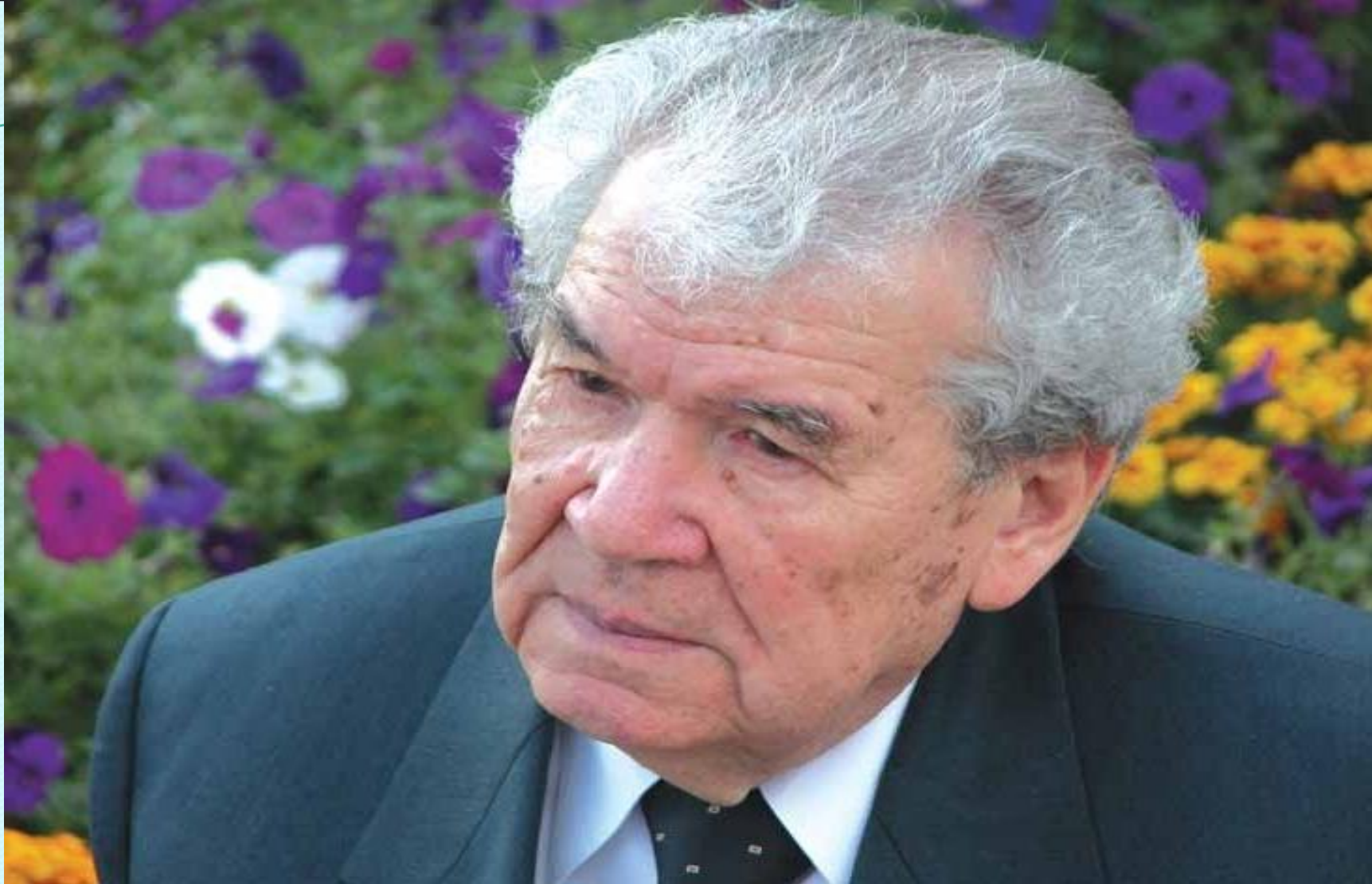
Мостай К1рим 1919-2005