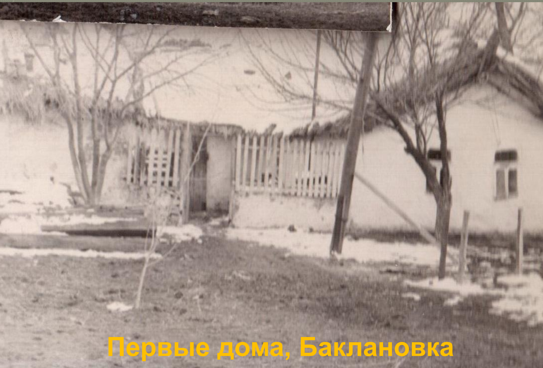
Первые дома, Баклановка