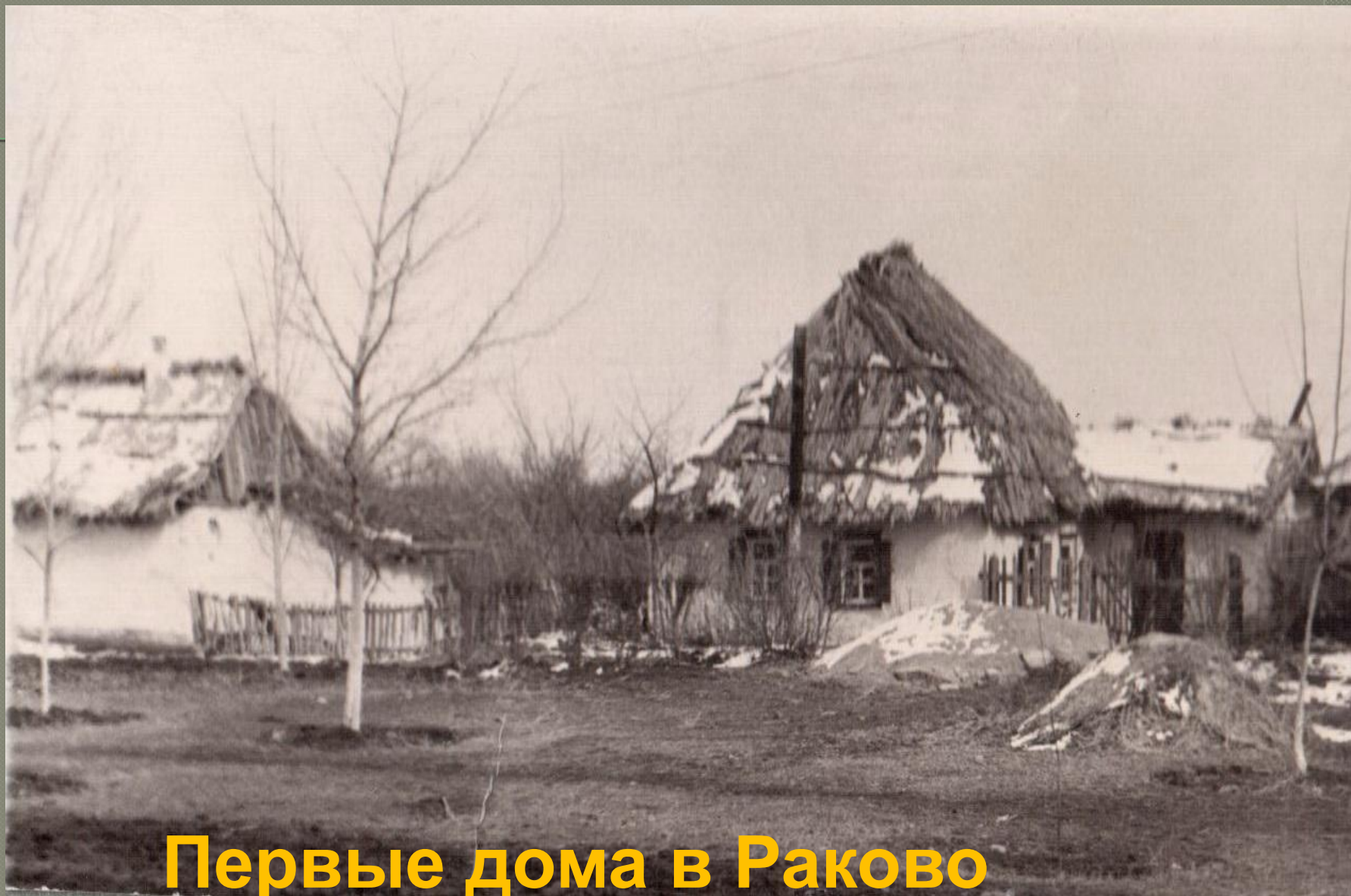
Первые дома в Раково