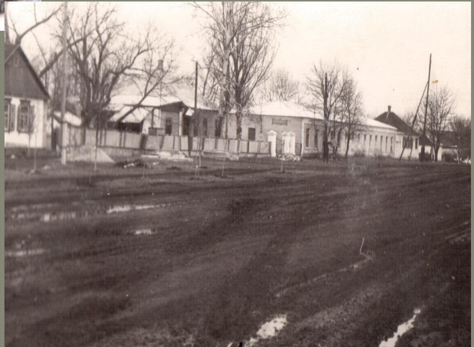
Главная улица (Кут), ныне улица Бережного