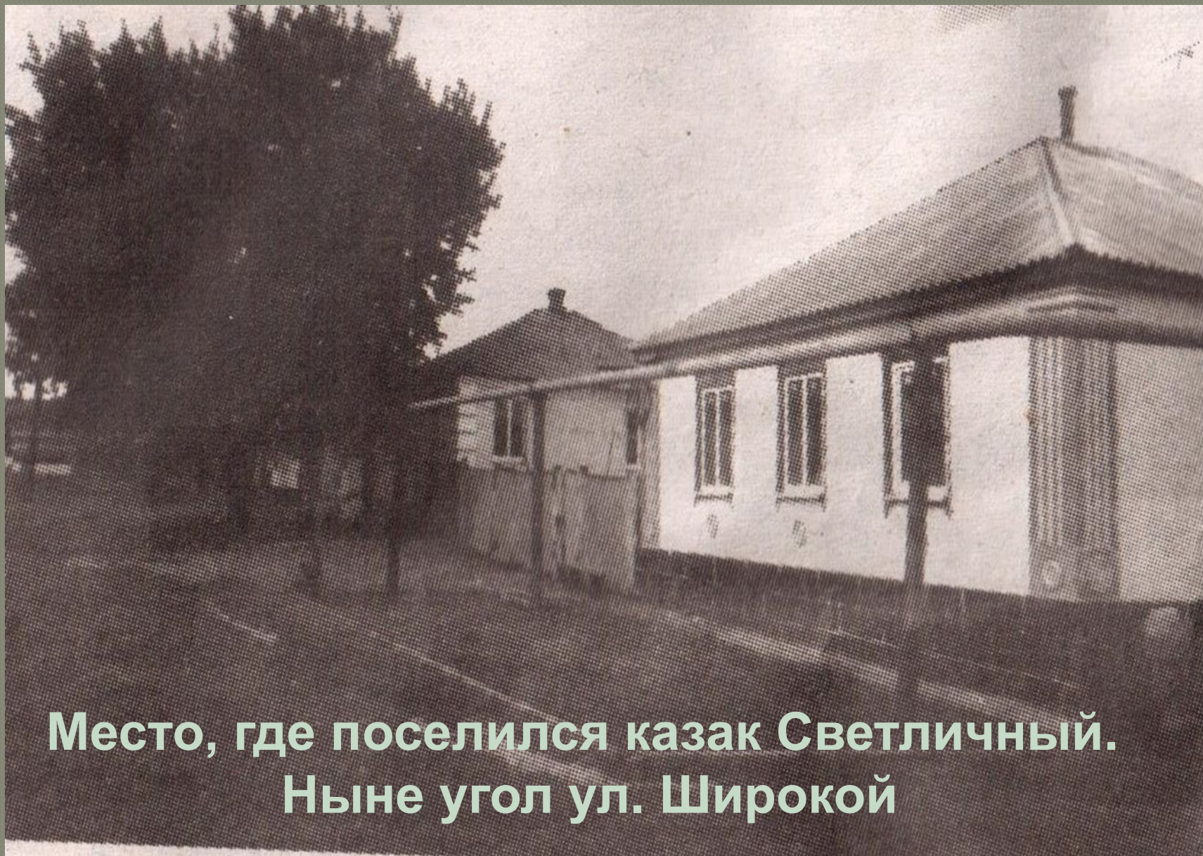
Место, где поселился казак Светличный. Ныне угол ул. Широкой