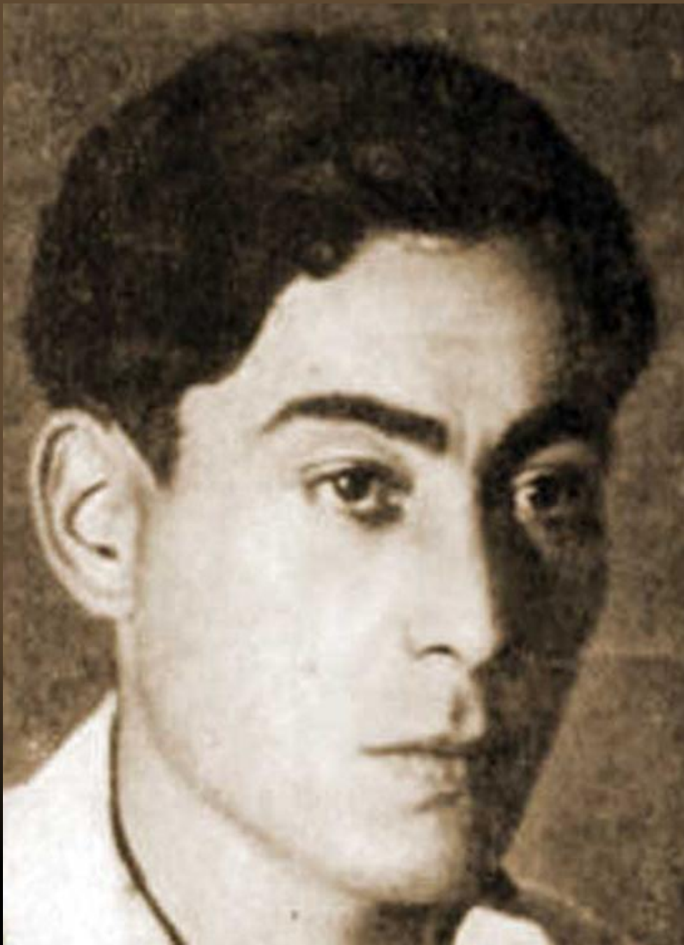
Эффенди Мансурович Капиев (1909-1944)